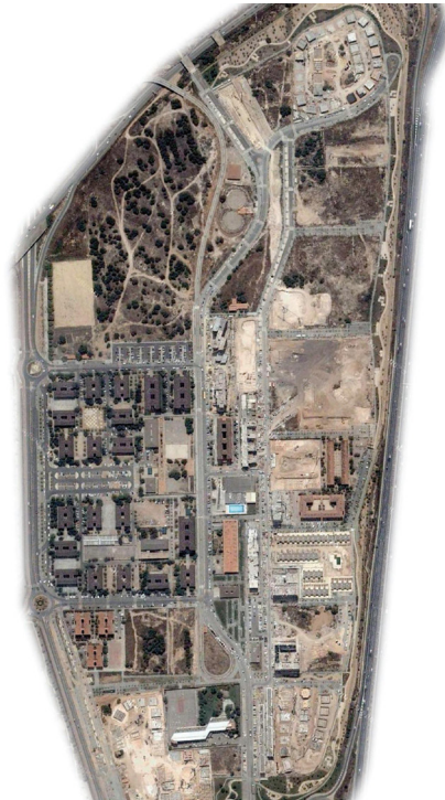
FIGURA 2. Mapa de delimitació territorial del barri La Coma, presa de la Monografia Comunitària 2012