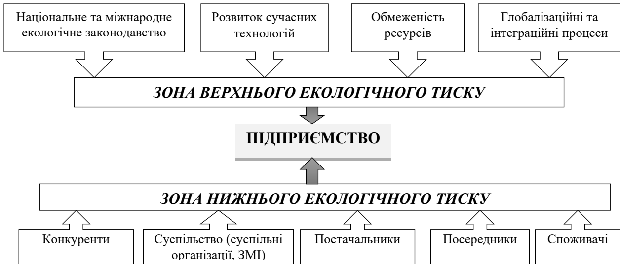
Рисунок 2 – Модель екологічного тиску на сучасні суб'єкти господарювання (на основі [3])

Концепція сталого розвитку, зростання добробуту населення, підвищення його правової культури породило вимогу щодо наявності якісно нової продукції. Таким шляхом людство робить свій внесок у реалізацію концепції екоорієнтованої економіки (рис. 2).