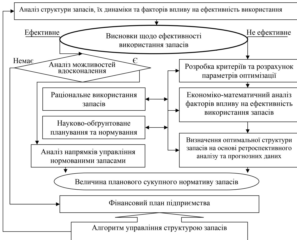
Рис.1. Модель управління структурою запасів

Частка запасів в оборотних активах підприємства досить значна, і коливається в межах від 77,4-89,6%, тобто протягом досліджуваного періоду структура їх зазнала несуттєвих змін. Оптимізація структури запасів - це кінцева мета раціонального управління запасами (рис.1). Змінюючи їх структуру, можливо поліпшити забезпеченість виробництва без збільшення обсягів запасів.