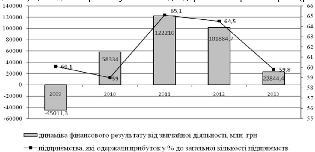
Рис.1. Динаміка фінансового результату від звичайної діяльності в 2009-2013 рр.