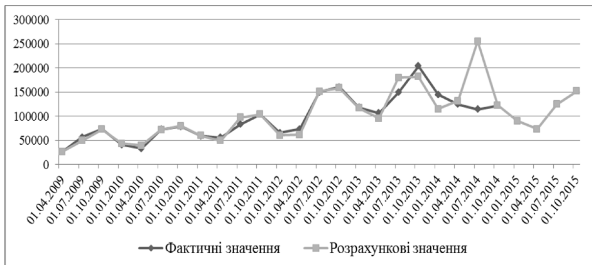
Рис. 2. Прогноз пасажиропотоку ТОВ «Нью Системс АМ», осіб

За результатами проведених розрахунків побудовано графік, на якому проілюстровано моделювання значень пасажиропотоку ТОВ «Нью Системс АМ» (рис. 2).