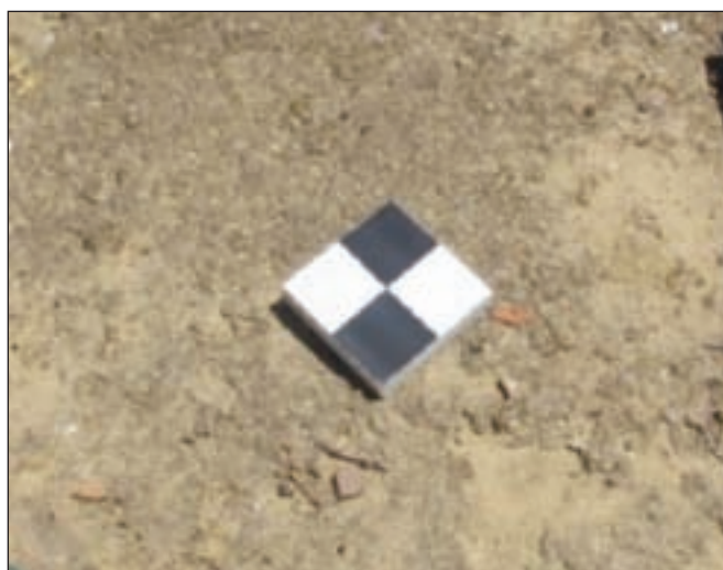
Figura 9 - Esempi di punti d'appoggio pre-segnalati.

le relazioni analitiche della fotogrammetria (equazione di collinearità) per potere effettuare le misure sull'oggetto a partire dalle corrispondenti misure sulle immagini. Durante le procedure di orientamento esterno dei rilievi con SAPR vengono in genere contestualmente determinati sia i parametri di orientamento interno (distanza principale, posizione del punto principale) e di distorsione dell'obiettivo della camera sia i parametri di orientamento esterno di ogni singola immagine. La procedura di orientamento esterno si basa sulla misura nelle immagini di punti di legame ( tie point ), calcolati automaticamente, e di punti di appoggio misurati manualmente. I prodotti finali del processo di orientamento, oltre ai parametri di orientamento interno ed esterno di tutte le immagini, sono rappresentati anche da una "nuvola di punti" sparsa che descrive in modo approssimato l'oggetto in