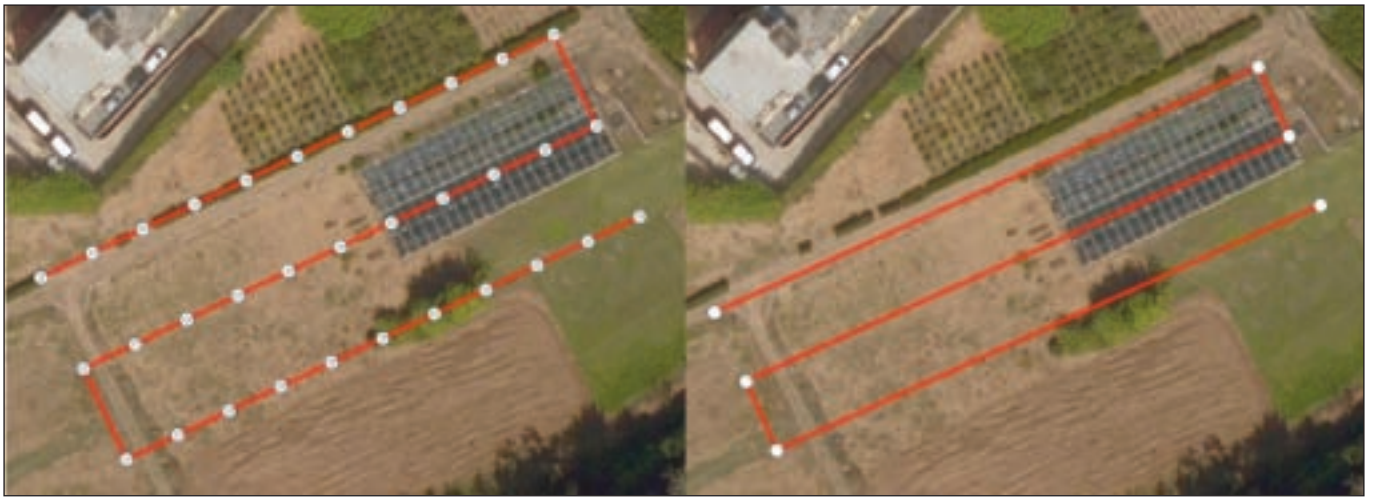
Figura 7 - Esempio di progetto di prese con scatto in corrispondenza dei waypoint ( a sinistra ) e con scatto in continuo ( a destra ).

ta caso per caso in relazione alla precisione che si vuole ottenere, al livello di dettaglio delle immagini, all'estensione della zona di rilievo, alla tipologia di APR, alle condizioni logistiche, e la percentuale di ricoprimento, che in genere è abbastanza costante e nel caso dei SAPR viene mantenuta sempre intorno a valori tra 70% e 80% per il ricoprimento longitudinale e tra 40% e 70% per quello trasversale. Nel caso di prese stereoscopiche nadirali eseguite con multicottero è possibile valutare due procedure (Fig. 7): prese eseguite su waypoint predeterminati e scatto in continuo della camera. La prima è la procedura più affidabile per rilievi fotogram-