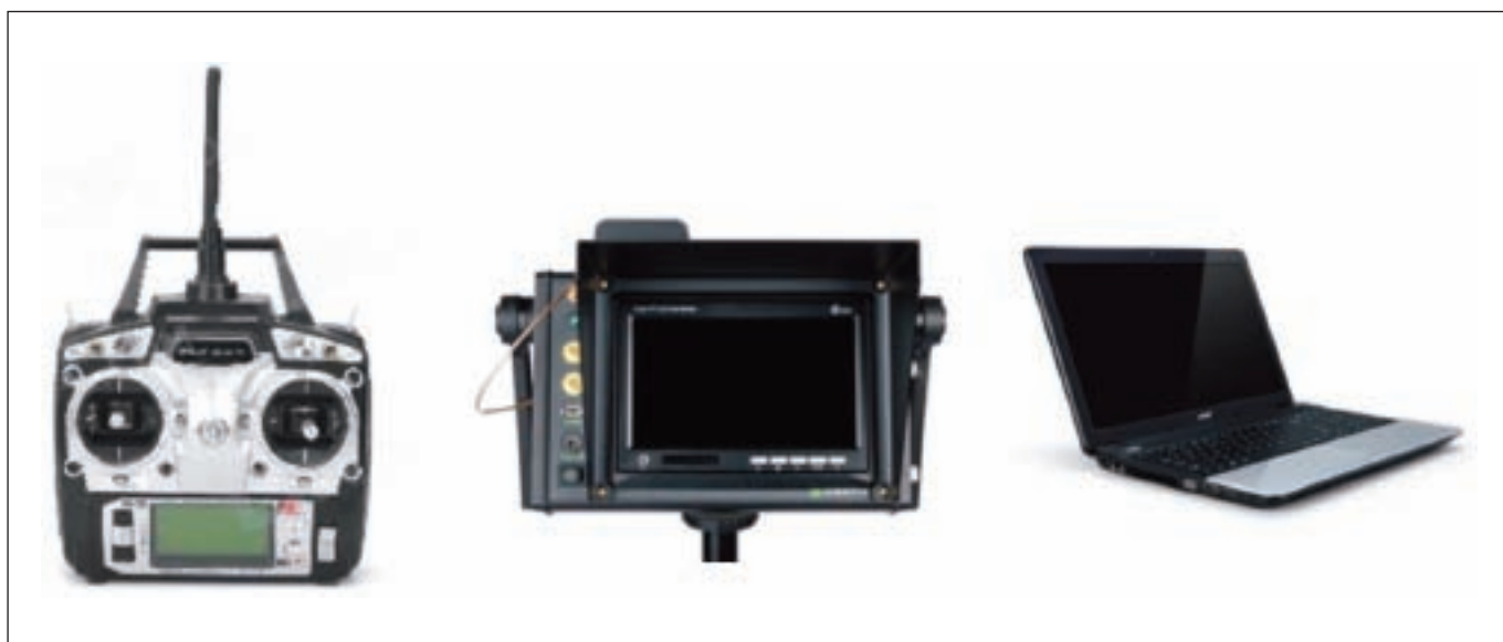
Figura 3 - Componenti della stazione di controllo a terra: radiocomando, tablet, notebook.

volo, modalità di acquisizione (Lo Brutto et al., 2014). Il multirotori hanno, infatti, resistenza al vento inferiore, possono volare a quote di volo anche molto basse (10-20 metri), hanno una maggiore flessibilità in fase di acquisizione in quanto consentono di effettuare riprese sia nadirali che inclinate grazie alla possibilità di ruotare il sensore tramite un supporto mobile definito gimbal che può essere comandato dal pilota remoto in maniera indipendente dal velivolo. I velivoli ad ala fissa volano a quote sempre superiori ai 100 metri, consentono l'esecuzione soltanto di riprese nadirali secondo il classico schema di fotogrammetria aerea, hanno capacità di carico molto basse che limita notevolmente le tipologie di sensori che possono montare.