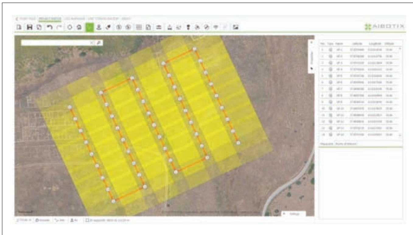
Figura 4 - Tipica schermata del software di controllo e progettazione del volo con indicato la posizione dei singoli waypoint e l'abbracciamento per ogni immagine.

Le due tipologie di velivoli, pur appartenendo alla stessa grande categoria dei mini APR, e pur avendo campi di applicazione simili, si differenziano anche per le finalità del rilievo e per le caratteristiche dei prodotti che possono essere ricavati dal loro impiego: rilievi a grandissima scala (pixel 1 o 2 cm, accuratezze del rilievo anche sub-centimetriche) di zone con estensione limitate nel caso dei multirotori, rilievi a grande scala (pixel circa 5 cm, accuratezze del rilievo centimetriche) di aree anche estese qualche chilometro quadrato per i velivoli ad ala fissa.