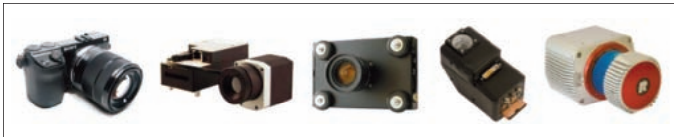
Figura 5 - Tipici sensori utilizzati nei SAPR (da sinistra verso destra): camera fotografica, termocamera, camera multispettrale, camera iperspettrale e laser scanner.

tono all'APR di volare e di gestire autonomamente le missioni programmate. Il giroscopio è il sensore che permette al multirottore di mantenere l'assetto nei 3 assi nonostante eventi esterni tendano a modificarlo. L'accelerometro è il sensore grazie al quale il mezzo sa sempre qual'è l'orizzonte rispetto al suolo, riuscendo quindi a riposizionarsi automaticamente in maniera parallela al suolo. Il barometro rileva le variazioni di pressione dovute al cambio di quota e pertanto consente al sistema di conoscere e mantenere la quota relativa di volo. Il magnetometro è la bussola elettronica che viene usata in combinazione con il GPS per definire la posizione. Il GPS è il dispositivo che permette di conoscere la posizione del mezzo e di seguire traiettorie per gestire in maniera automatica le missioni programmate.