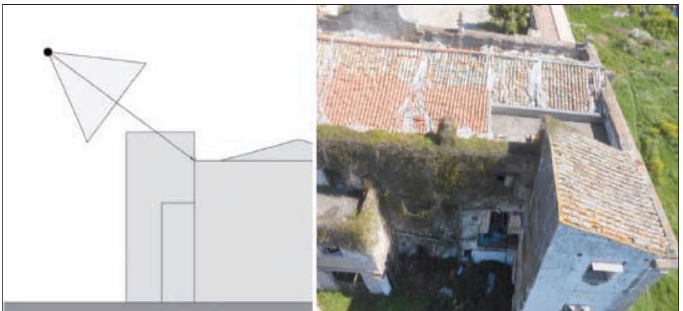
Figura 8 - Esempio di prese inclinate in ambito architettonico.

Le prese inclinate e/o convergenti rappresentano lo schema tipico della fotogrammetria terrestre che, nel caso dei SAPR, è in genere utilizzato soprattutto per rilievi fotogrammetrici in ambito architettonico (Fig. 8)