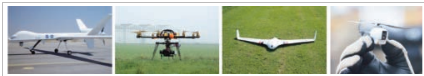
Figura 1 - Esempi di velivoli che rientrano nella categoria degli APR tattici.

Gli Aeromodelli, a differenza dei SAPR possono essere utilizzati senza sottostare al Regolamento ENAC; il loro utilizzo però è possibile solo se vengono rispettate determinate condizioni.