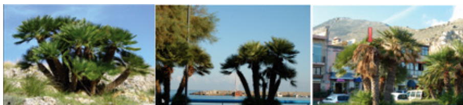
Figure 3. a) Mediterranean shrub lands with Chamaerops humilis ; b) C. humilis used as ornamental tree along sea promenade, May 2010; c) RPW infested C. humilis , October 2012. Arrow indicates infested palm.

From its first report in Sicily, the RPW rapidly attacked P. canariensis causing significant damage and amplifying the spectrum of hosts, Washingtonia spp., Sabal spp., including the endemic Mediterranean species C. humilis L. (Figures 3a-c). This poses a threat to natural plant communities, biodiversity and landscape, and especially in the case of islands and other isolated ecosystems [8].