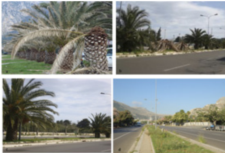
Figure 5 a-d. Palm trees of viale dell'Olimpo showing three different phases of the RPW attack. In last photo the infested palms were cut off. Different phases of the RPW attack: a) initial situation, b – c) during RPW attack; d) present situation, notice no one palm is present.

RPW attacks have led to a drastic decrease in the number of these plants, resulting in a radical change in the configuration of urban spaces which could continue to change even further. Photos regarding the same location before the presence of the RPW, during attacks and the present-day situation can give a measure of the damage (Figures 4, 6-8). Some examples shown below, give an idea of this expected tragedy. Palm trees are gradually disappearing from one of the most famous palm tree boulevards, Viale dell'Olimpo (Figures 5 a-d). Few palm trees are now present along the sea promenade, Foro Italico , where before there was a famous “ Palmeto ” (palm tree grove) there are now oleanders ( Nerium oleander L.) instead of palm trees (Figures 6 a-b). Dead palms are evident in almost every street and square of the city, even in the historical Piazza Vittoria in front of Palazzo dei Normanni (Figure 7a), close to the beautiful Church of San Giovanni degli Eremiti (Figure 7b) and in Piazza Politeama (Figure 7c).