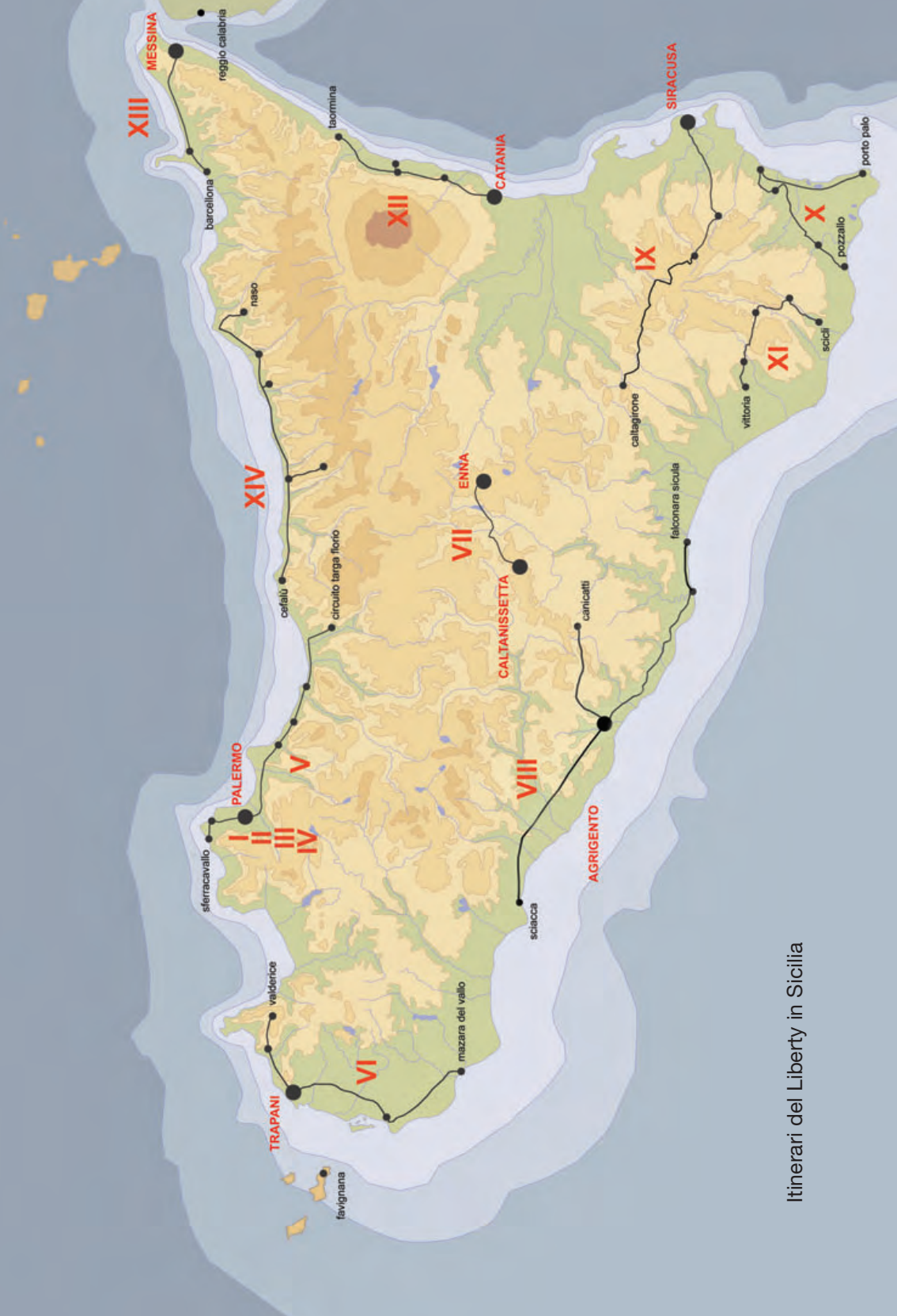
Itinerari del Liberty in Sicilia