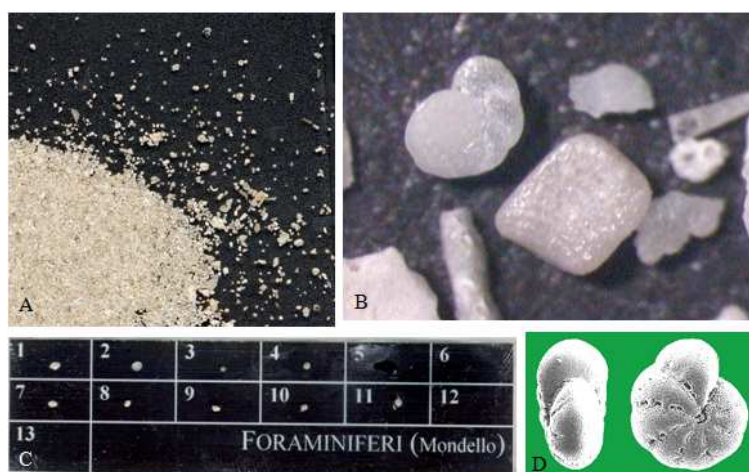
Figura 1. Osservazione foraminiferi: della sabbia raccolta, da osservare inizialmente ad occhio nudo (A), si effettuano osservazioni con la lente di ingrandimento (B) e successivamente al microscopio binoculare con il supporto di un vetrino contenente le principali forme di gusci dei foraminiferi (C): organismi unicellulari marini, il cui guscio è facilmente ritrovabile nella sabbia del mare (D).

Ancora, si è messo in atto un percorso per cui i bambini partendo dalla comprensione/osservazione dell'organizzazione cellulare dello sviluppo e della metamorfosi sono giunti alla scoperta dell'ereditarietà delle somiglianze e quindi alla modalità di trasmissione dei caratteri genetici, approdando anche al concetto scientifico di “probabilità”. Sono state trattate le unità d'apprendimento relative a cellule, microorganismi o lo studio di semplici modelli animali usando diversi tipi di percezioni sensoriale e di osservazione (figura 2).