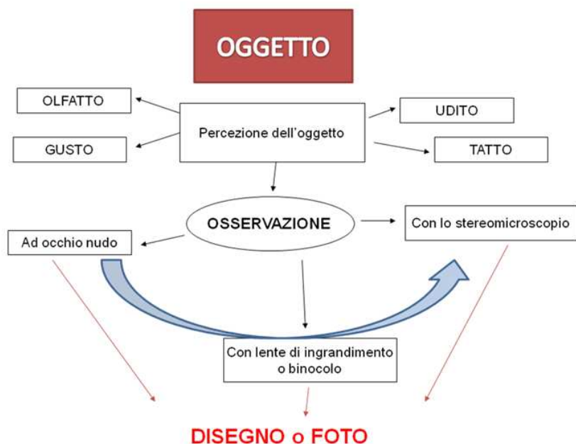
Figura 2. Schema a blocchi dello studio del oggetto in relazione alla sua percezione ed ai diversi tipi di osservazione e rappresentazione progressiva.

Ancora, si è messo in atto un percorso per cui i bambini partendo dalla comprensione/osservazione dell'organizzazione cellulare dello sviluppo e della metamorfosi sono giunti alla scoperta dell'ereditarietà delle somiglianze e quindi alla modalità di trasmissione dei caratteri genetici, approdando anche al concetto scientifico di “probabilità”. Sono state trattate le unità d'apprendimento relative a cellule, microorganismi o lo studio di semplici modelli animali usando diversi tipi di percezioni sensoriale e di osservazione (figura 2).