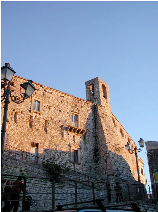
Figura 2. Il castello federiciano di Giuliana centro dell'U.I. dei Sicani e del Medioevo Federiciano

L'eremo di Tagliavia, al centro di un vasto sistema agricolo cerealicolo, e Entella mitica città degli Elimi rappresentano l'aspetto identitario dell'U.I. legato alla produzione cerealicola che disegna il paesaggio, le relazioni storiche, i luoghi dell'insediamento umano, la sacralità del paesaggio.