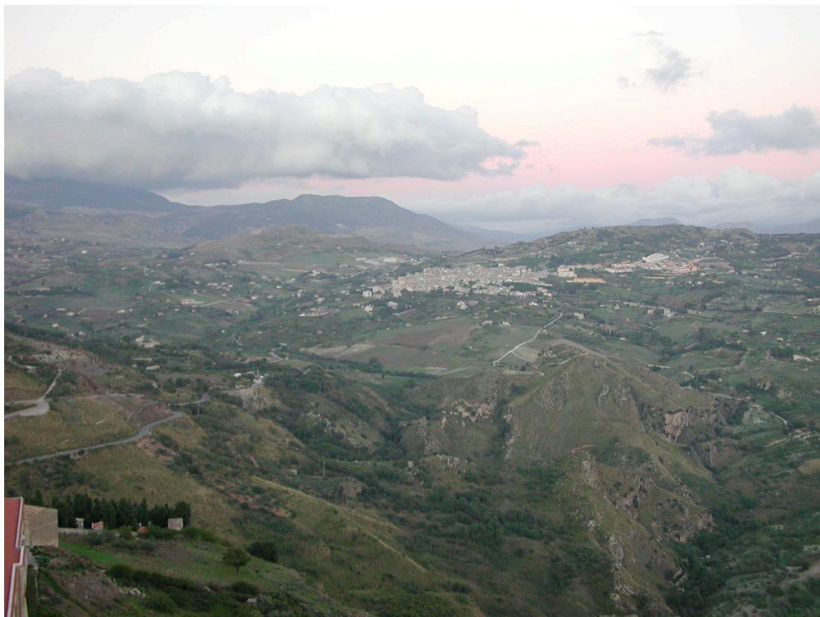
Figura 3. Il contado di Giuliana dalla torre del castello federiciano

Il castello di Giuliana nella significazione dell'U.I. è anche luogo dell'intervisibilità per difesa e controllo e del legame tra il dominus e il territorio su cui esercita la sua potestà Federico II di Svevia.