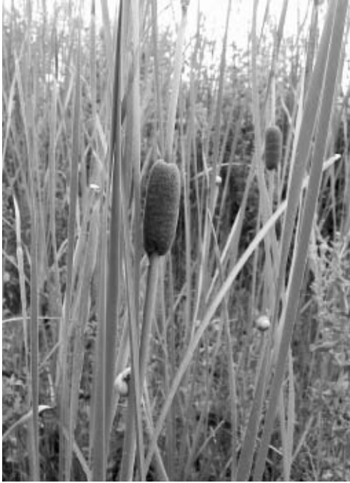
Fig. 1 — Typha laxmannii Lepech. presso l'abbeveratoio in contrada Visicari a Scopello (TP).