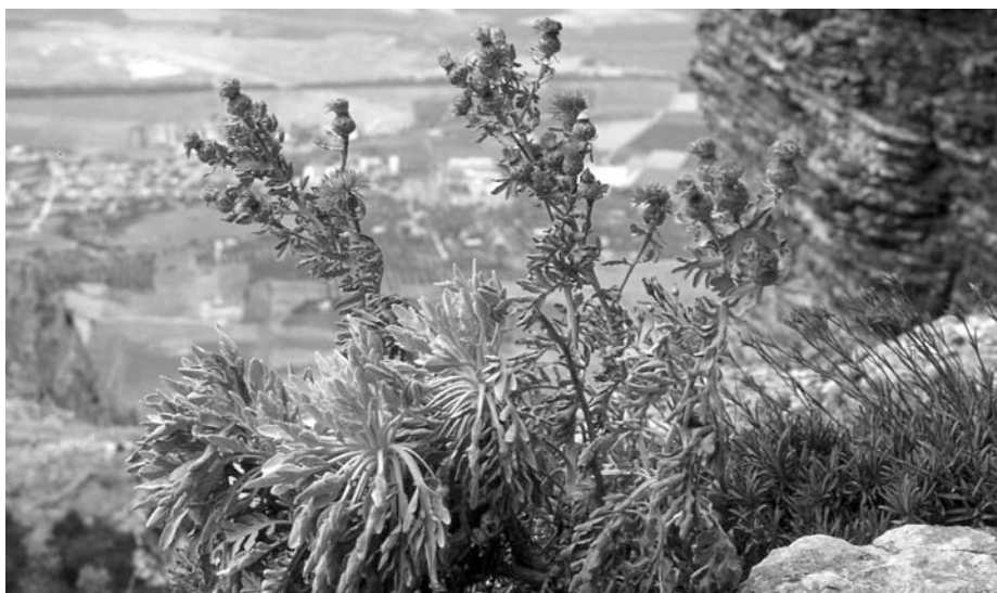
Fig. 3 — Centaurea erycina Raimondo & Bancheva sulle rupi di Erice.