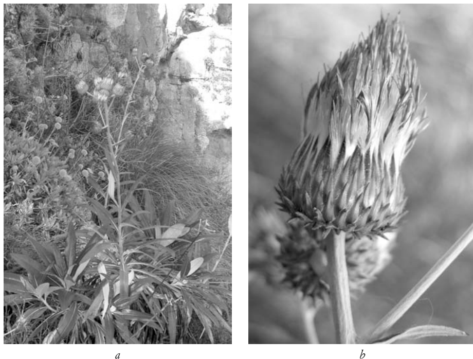
Fig. 4 — Ptilostemon greuteri Raimondo & Domina: a) vista generale, con habitus e habitat della specie; b) particolare dell'infiorescenza.

tuttavia, rilevare che popolazioni della prima sottospecie sono state attribuite anche a territori delle province limitrofe (Raimondo et al. 1991). Tali attribuzioni sono oggi ritenute erranee e probabilmente da ricondurre ad altro taxon.