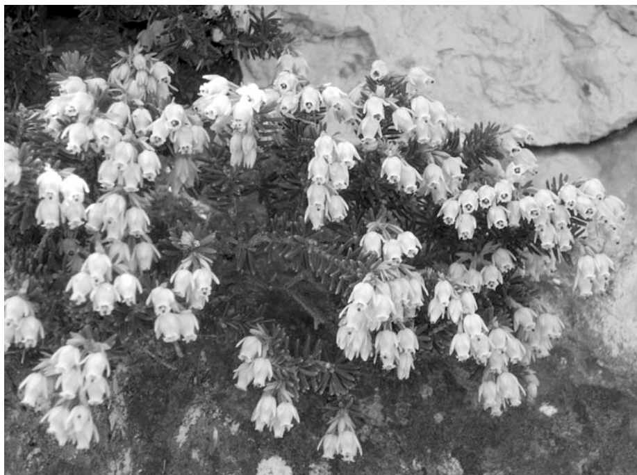
Fig. 2 — Erica sicula Guss. subsp. sicula a monte Cofano. Oltre che in questa località, l'entità era stata segnalata anche a Marettimo, ma per l'isola mancano conferme recenti.