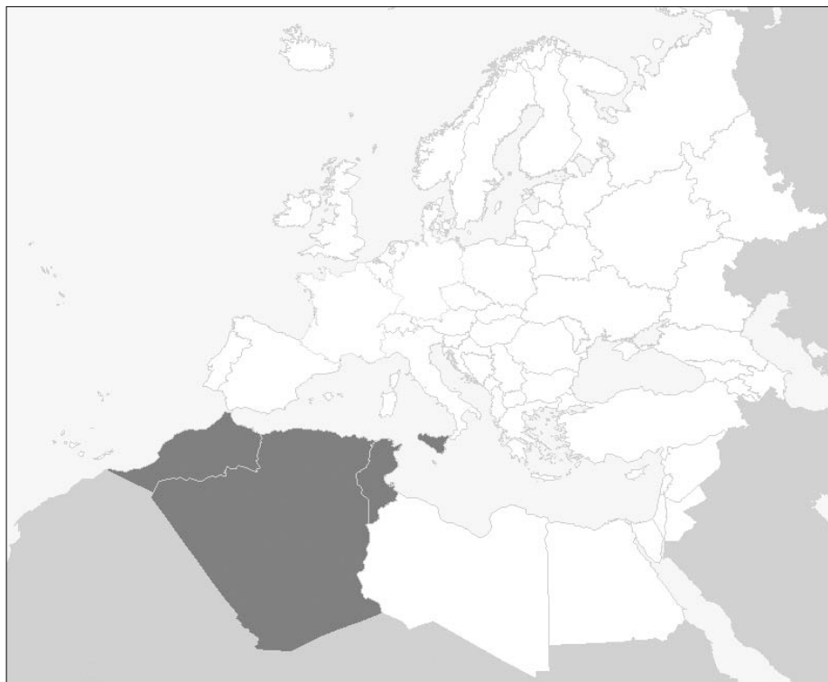
Fig. 6 — Distribuzione di Lonas annua (L.) Vines & Druce (da EURO+MED, 2006-2010). Si evidenzia che le popolazioni siciliane (quasi interamente concentrate nella provincia di Trapani) sono le uniche popolazioni europee certamente spontanee (native), a fronte di un areale di distribuzione prettamente nord-ovest africano.