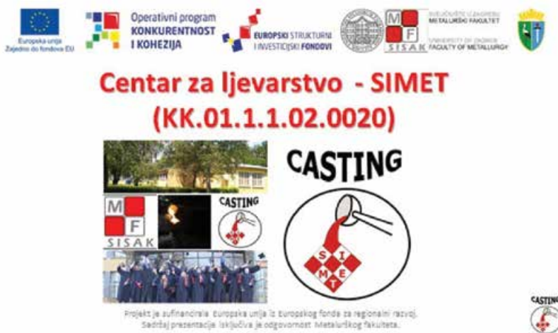
Slika 4: Predstavljanje i vizualne oznake projekta Centra za ljevarstvo - SIMET

Metalurška proizvodnja smatra se jednim od glavnih čimbenika koji utječe na razvoj svjetske ekonomije. U svijetu je ona profitabilna dok je u Republici Hrvatskoj identificiran niz problema, među kojima su loše poslovno okruženje, nedostatak investicija te loša komunikacija između malih i srednjih poduzetnika iz područja metalne industrije, znanstvenih institucija, visokih učilišta te lokalnih i regionalnih vlasti. Projekt Centra za ljevarstvo – SIMET je prilika za promijeniti okolnosti. Uvažavajući teorijska znanja, metalurška struka snažno se oslanja na gospodarstvo u međusobnoj razmjeni znanja i iskustva. U okviru Centra za ljevarstvo – SIMET, predviđene aktivnosti istraživanja i razvoja, uz ostale aktivnosti povezane s uvođenjem inovacija u poduzeća, neophodne su za pozicioniranje, prepoznatljivost izvrsnosti Metalurškog fakulteta, prepoznatljivost i vidljivost Sveučilišta u Zagrebu, povratak Siska i Sisačko-moslavačke županije u status centra atraktivne znanstvene izvrsnosti, procesnih znanja i kompetencija te niše za razvoj gospodarstva Republike Hrvatske.