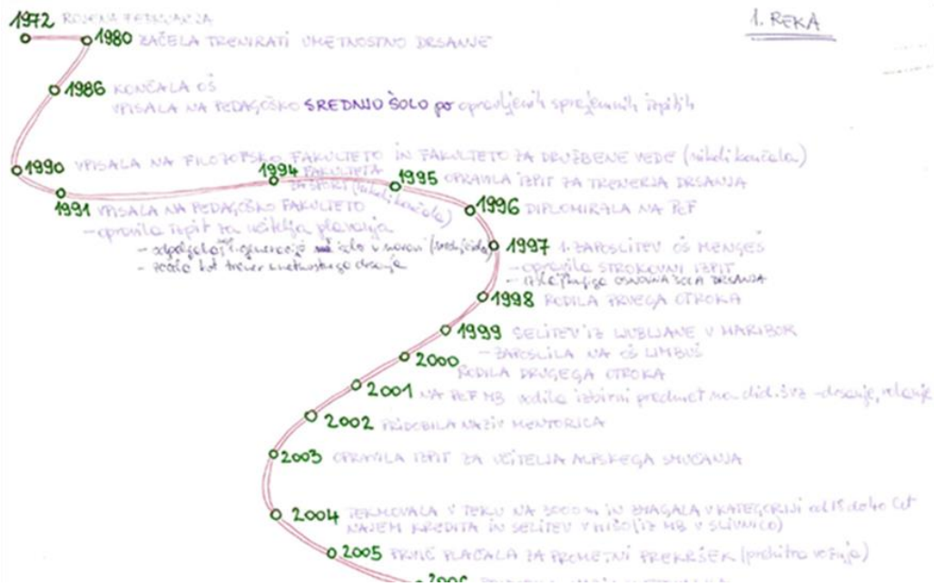
Slika 1. Tinina rijeka profesionalnog razvoja.

Ideju o životu često ilustriramo rijekom - rijekom života koja teče iz prošlosti u budućnost (Slika 1, 2). Metoda istraživanja Rijeka profesionalnog života koristi se za ilustraciju vanjskih i unutarnjih događaja i promjena na njihovom putu profesionalnog razvoja [9].