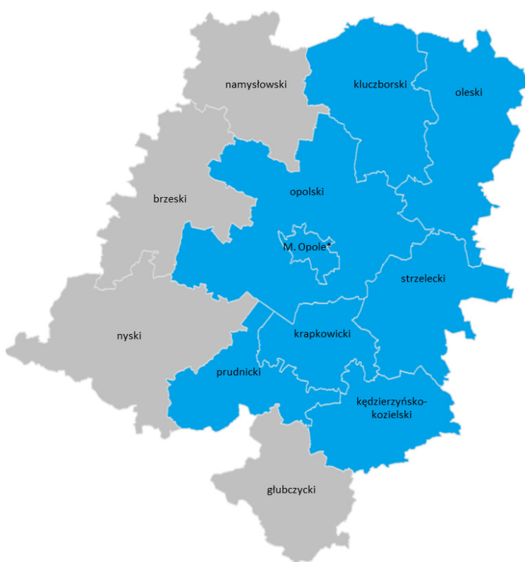
Rys. 1: Powiaty, w których mniejszość niemiecka zarejestrowała swoje komitety wyborcze w 2010 i 2014 r.

Pierwszym sygnałem ich siły politycznej były wybory uzupełniające do Senatu z lutego 1990 r., kiedy to lider ruchu mniejszości niemieckiej przegrał wprawdzie z przyszłą wieloletnią Senator RP Dorotą Simonides, to jednak uzyskane przez niego poparcie pokazało, że grupa ta będzie odgrywać istotną rolę w życiu politycznym regionu (więcej zob. Berlińska 1999; Szczepański 2013). Jedynie w przypadku wyborów prezydenckich i do Parlamentu Europejskiego 22 , mniejszość niemiecka rezygnuje z wystawiania własnych kandydatów.