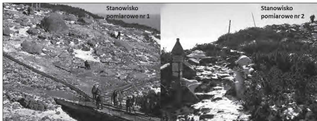
Ryc. 2. Stanowiska pomiarowe numer 1 i 2