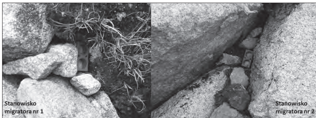
Ryc. 3. Stanowiska migratora numer 1 i 2

W trakcie badań w 2014 r. autorka posiadała tylko jeden czujnik. Zatem pomiaru dokonano na szlaku czerwonym w dwóch punktach pomiarowych: stanowisko pierwsze (1) na szlaku czerwonym w stronę Zielonego Stawu Kieżmarskiego oraz stanowisko drugie (2) na szlaku czerwonym w stronę Siodełka (ryc. 3.). Pomiar prowadzono od 1 lipca do 25 października. Miejsce migratora zmieniano po upływie około miesiąca tak, aby uzyskać dane z jednego miesiąca letniego i jednego jesiennego, dla poszczególnych stanowisk. W dniu 1 lipca 2014 roku, migrator zainstalowano na stanowisku pierwszym, następnie 9 sierpnia 2014 r., został on przeniesiony na stanowisko drugie. Dnia 22 września 2014 r., po upływie około dwóch miesięcy (jeden letni i jeden jesienny), migrator zainstalowano ponownie na stanowisku pierwszym. Czujnik został zdemontowany na okres zimowy w dniu 25 października 2014 r.