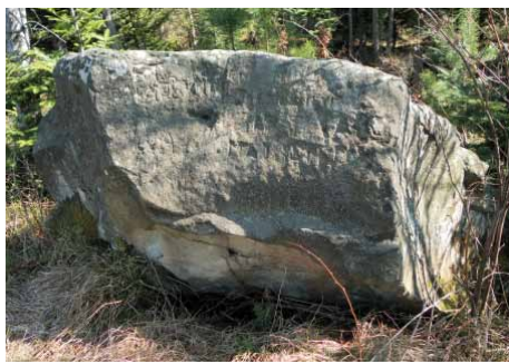
Laskowa Skała. Głaz wierzchołkowy pokryty rytymi napisami