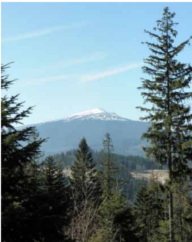
Widok Babiej Góry spod szczytu Kielka

Droga zagłębia się w las i szybko doprowadza do rampy, za którą na świerku wisi duża kapliczka szafkowa z obrazem Matki Bożej Nieustającej Pomocy w środku, ogrodzona drewnianym płotkiem (dotąd z przystanku 10 min.). Wokół obrazu znajdują się dziękczynne wota, świadczące o uproszonych łaskach.