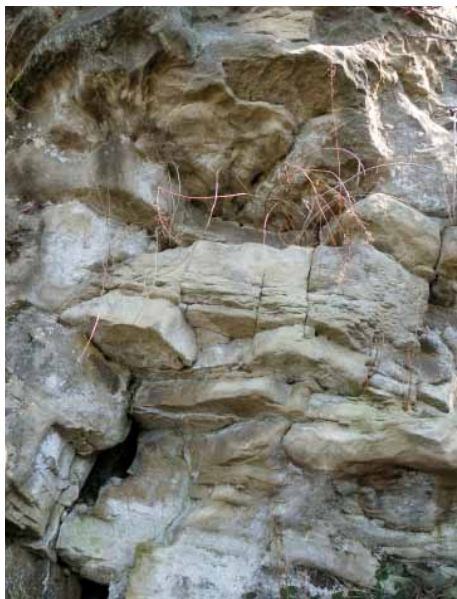
Laskowa Skała. Fragment ławic piaskowców magurskich o różnej strukturze i uławiceniu