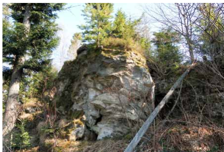
Laskowa Skała. Jedna z baszt skalnych

Trasa C – z Sidziny Górnej przez Brożek. Podobnie jak w przypadku trasy B, punktem wyjścia jest tutaj przystanek autobusowy „Sidzina Górna”