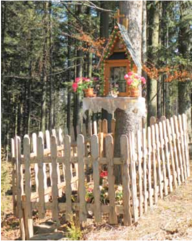
Sidzina Wielka Polana. Kapliczka przy leśnej drodze (fot. P. Krzywdą, 2014)