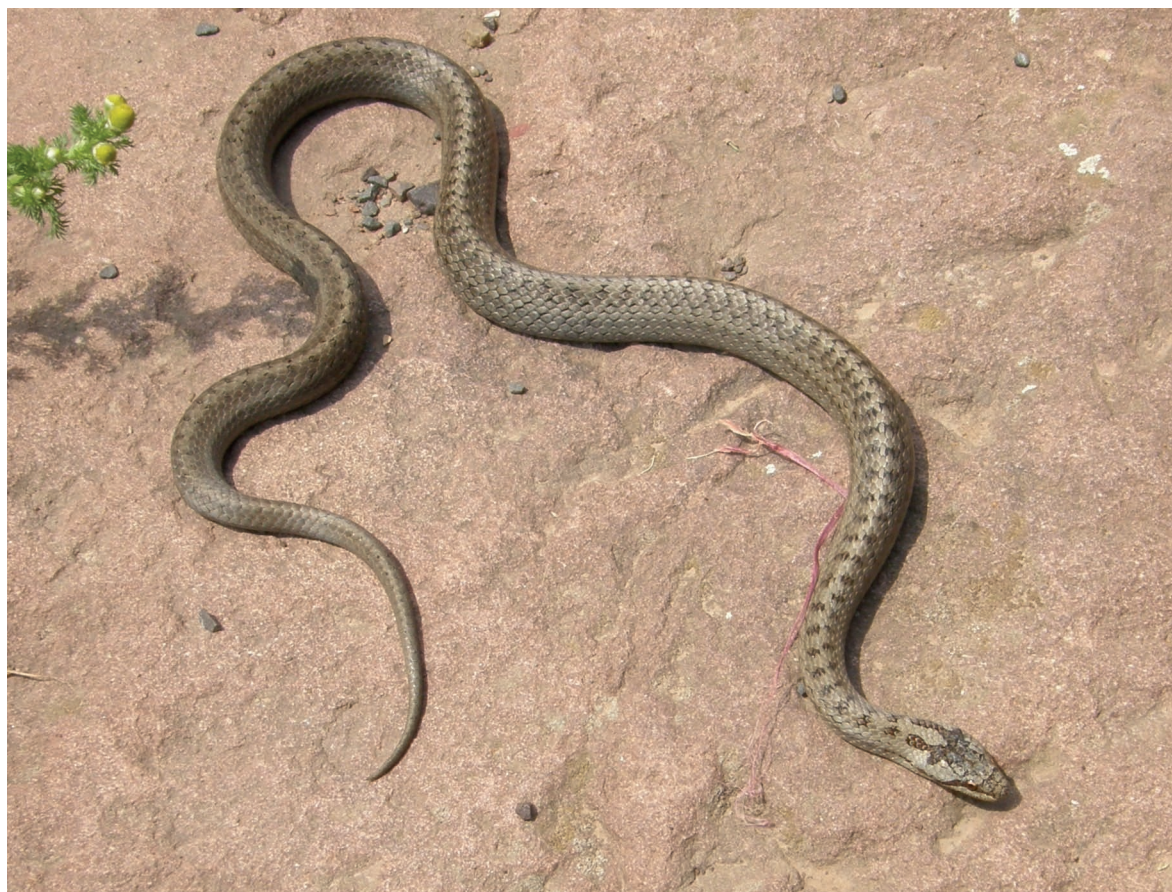
Ryc. 3. Gniewosz płamisty Coronella austriaca na kamiennej płycie (Tłumaczów, 29.05.2012 r.;) Fig. 3. Smooth snake Coronella austriaca on a stone slab (Tłumaczów, 29 May, 2012;)

sp. Liczne bloki i odłamki skalne tworzą usypiska, zwałowiska i piargi, a na wysokość około 15 m wznosi się niemal pionowa ściana skalna z wystawą południową. W dalszej odle-