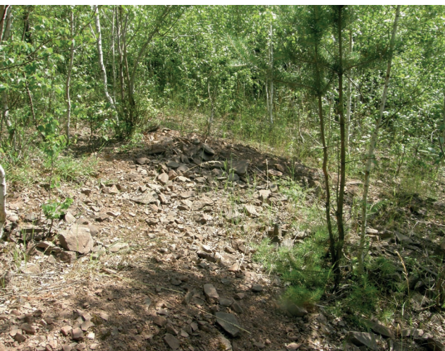
Ryc. 1. Odłamki skalne i kamienie – pozostałości po działalności wydobywczej (Tłumaczów, 29.05.2012 r.;)

Fig. 1. Rock shards and stones – remnants of mining activities (Tłumaczów, 29 May, 2012;)