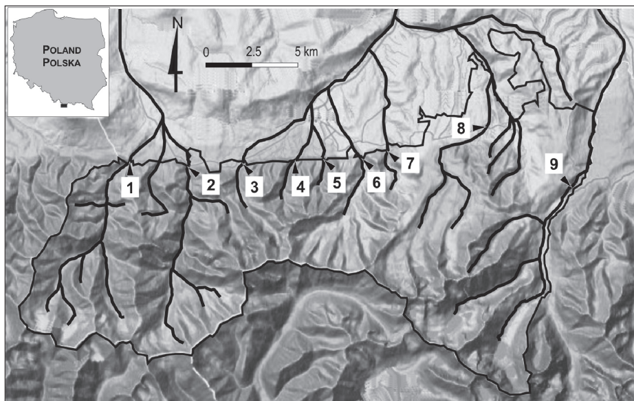
Ryc. 1. Położenie obszaru badań

Potoki: 1 – Chochołowski, 2 – Kościeliski, 3 – Małolącki, 4 – Strążyski, 5 – Biały, 6 – Bystra, 7 – Olczyński, 8 – Sucha Woda, 9 – Białka