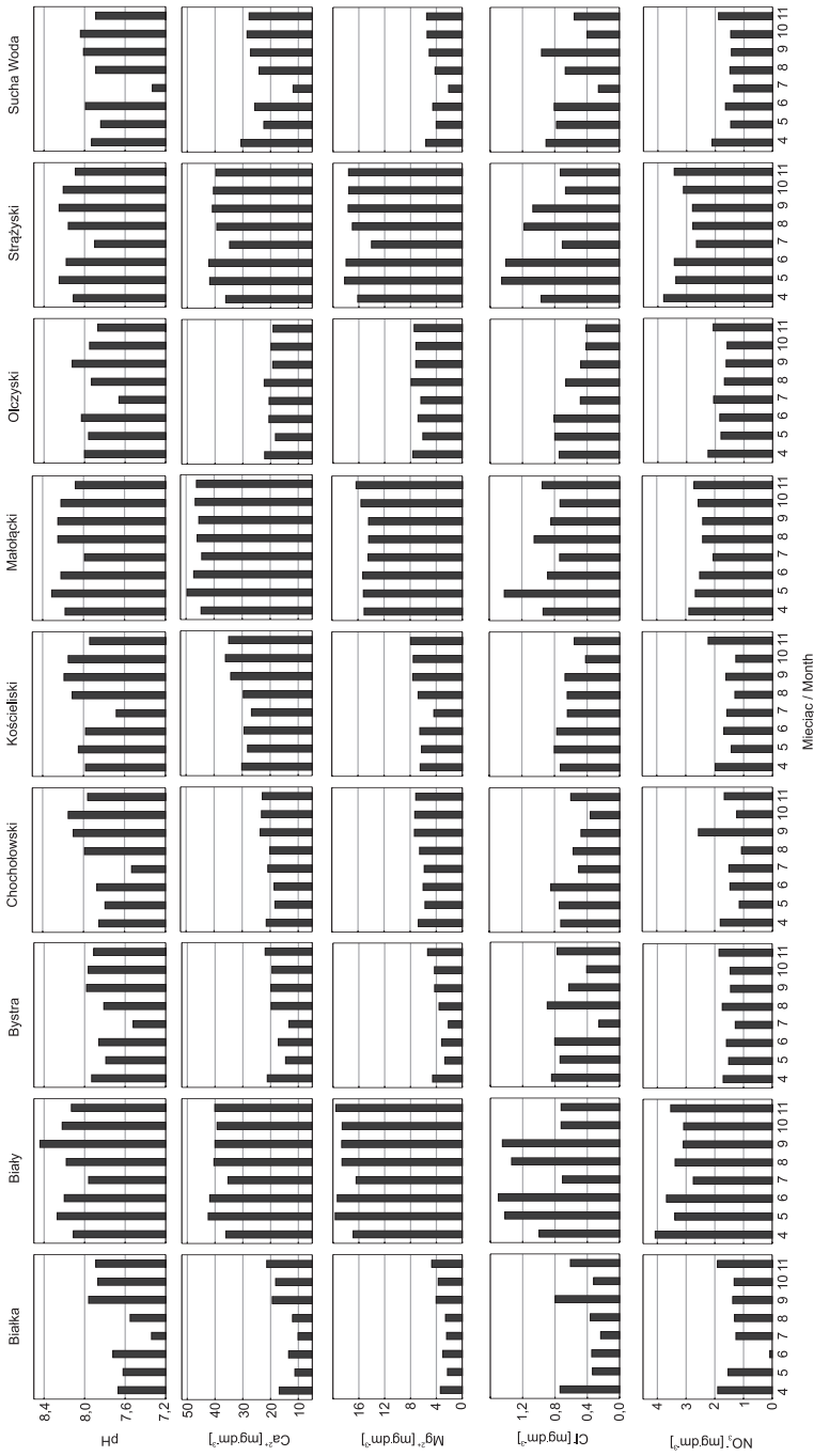
Ryc. 3. Sezonowe zmiany cech chemicznych wody potoków Fig. 3. Seasonal changes in the chemical properties of streamwater