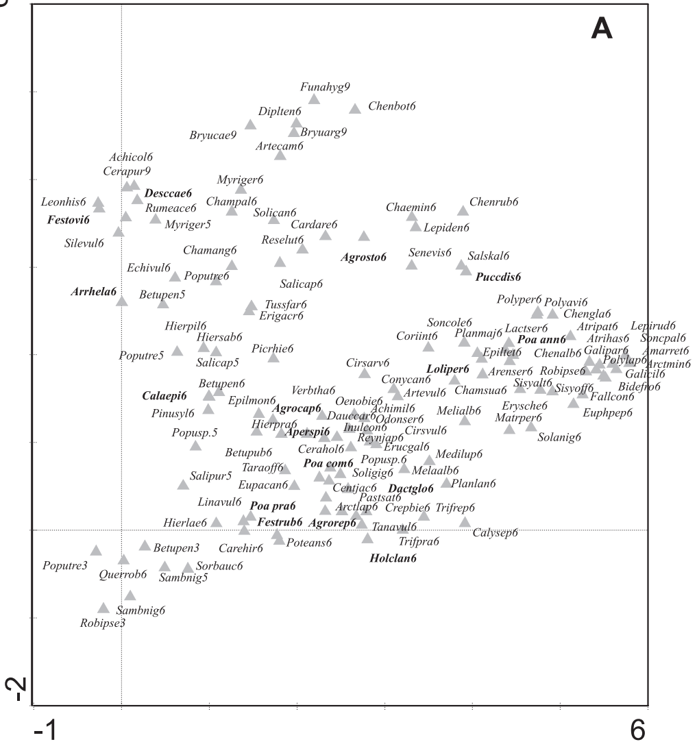
Ryc. 1A. Ordynacja DCA roślinności zwalów hutniczych żelaza zlokalizowanych na Wyżynie Śląskiej. A. Gatunki. Skróty nazw gatunków: cztery pierwsze litery – nazwa rodzajowa; trzy kolejne – nazwa gatunkowa; oznaczenie warstwy: 9 – warstwa mszysta, 6 – warstwa zielna; 5 – warstwa krzewów, 3 – warstwa drzew

Fig. 1A. The ordination DCA of vegetation connected with iron smelter affected lands of the Silesian Uplands A. Species. Species abbreviations: first 4 letters – genus name, 3 other letters – species name, layer code: 9 – moss layer; 6 – herb layer, 5 – low shrub layer; 3 – tree layer