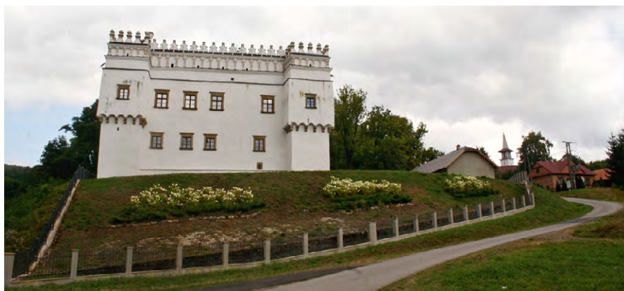
Ryc. 1. Zrewaloryzowany kasztel w Szymbarku z muzeum, salą konferencyjną i wystawową