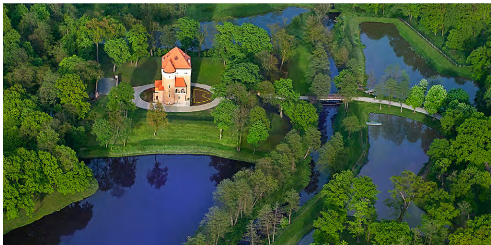
Fig. 5. Fortified manor house in Rzemień on the defensive island

The adaptation of fortified residential castles and grounds in the Cracow-Częstochowa Highlands involving 12 different sites shows what can be done to facilitate tourism of historic fortifications that are subject to legal protection of the historic site, the landscape and the environment. The development of tourism encompasses not only individual sites but also the wider context of a historic region. The castles mentioned have been included in the Trail of the Eagles' Nests and Jurassic Bike Trail. The Trail of the Eagles' Nests has a great deal of appeal for cultural tourism, especially military and historical tourism. Tourist trails for hiking or biking promote recreational outdoor activities and the geography and natural topography are conducive to rock climbing and caving, especially the limestone rocks of the Cracow-Częstochowa Highlands. Climbing routes with safety railings have been opened in the Mirów Rocks area.