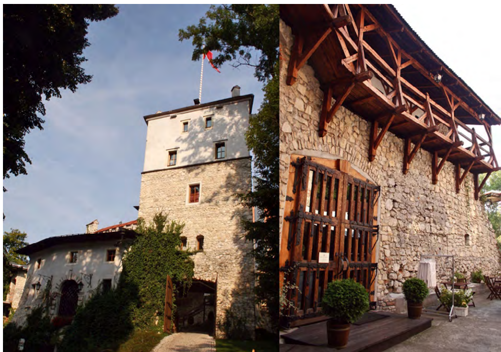
Ryc. 3. Zamek w Korzkwi – zrekonstruowana fasada z bramą wjazdową, dawne skrzydło mieszkalne i dziedziniec

Conference facilities predominate among the ways in which fortified manor houses have undergone conservation work for the aim of developing tourism. The manor