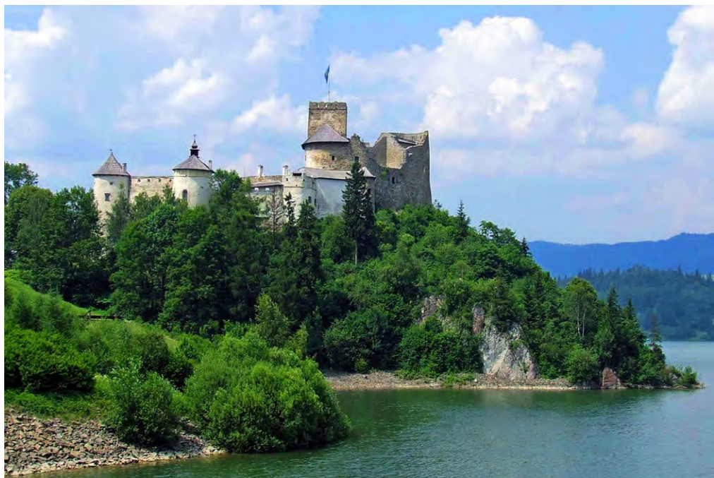
Ryc. 4. Zamek Dunajec w Niedzicy (fot. A. Pawłowska, 2013 r.)