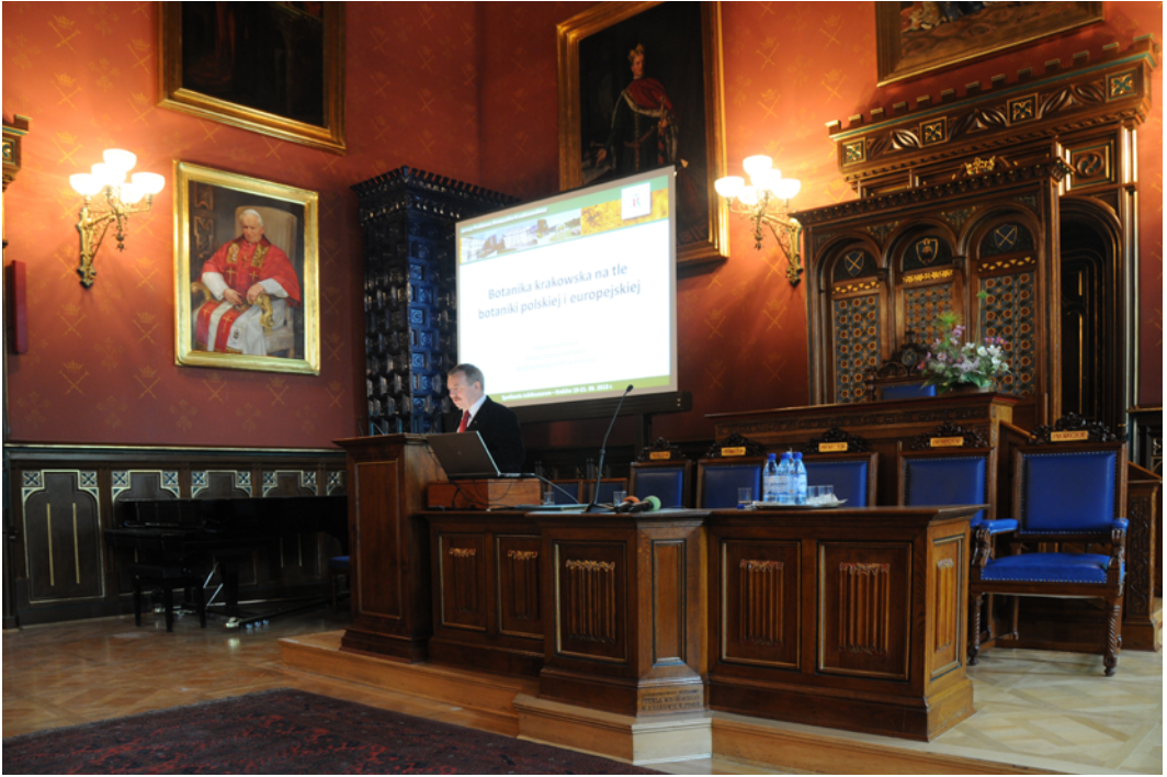
Ryc. 8. Prof. Bogdan Jackowiak wygłasza referat „Botanika krakowska na tle botaniki polskiej i europejskiej” w czasie sesji jubileuszowej w auli Collegium Novum.