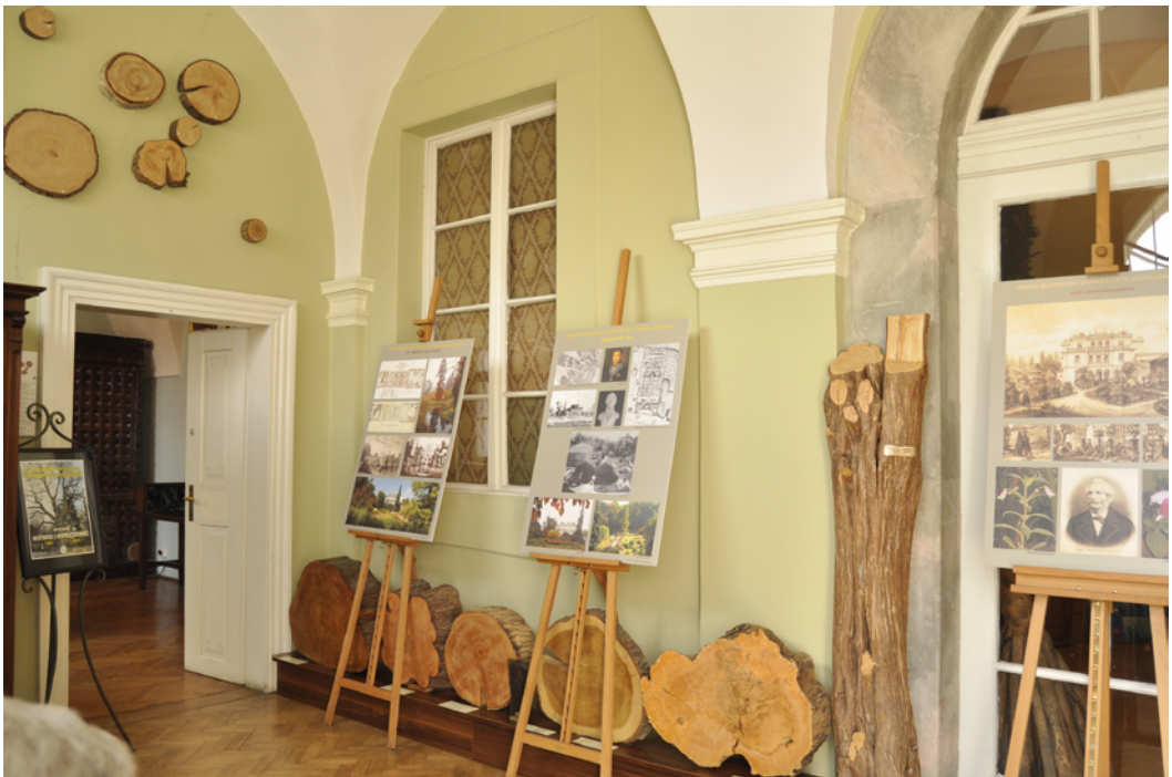
Ryc. 15. Wystawa „230 lat Ogrodu Botanicznego Uniwersytetu Jagiellońskiego. Historia i współczesność (1783–2013)” w Muzeum Ogrodu Botanicznego, Collegium Śniadeckiego UJ.