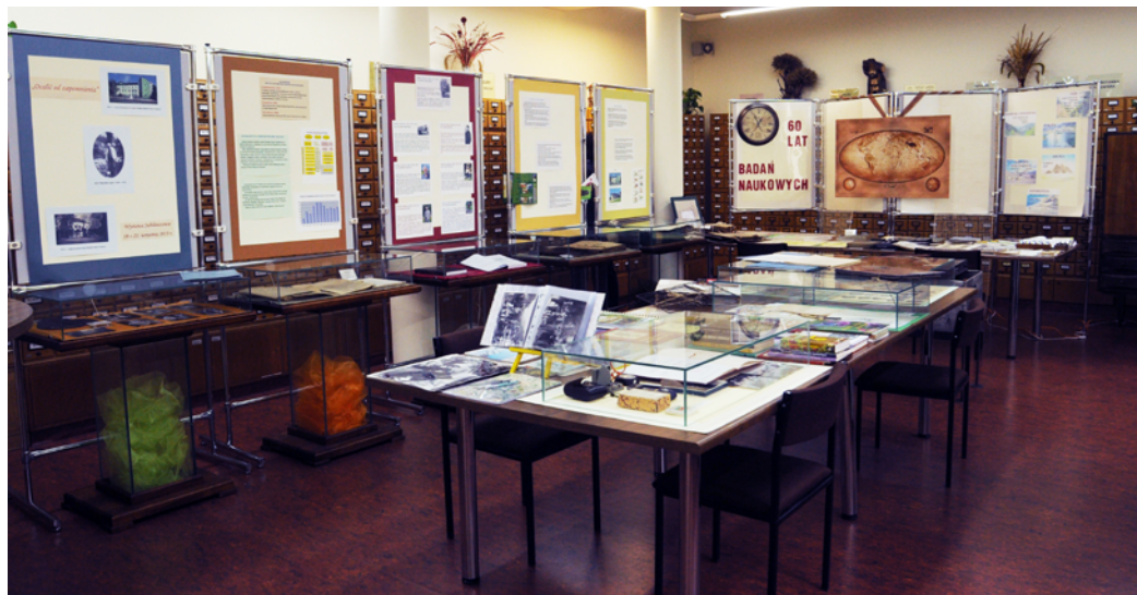
Ryc. 18. Wystawa „Ocalić od zapomnienia” w Bibliotece Instytutów Botaniki UJ i PAN (fot. A. Mróz).

Fig. 17. Photographic exhibition ‘Impressions of Nature in the objective lens’ by Marian and Michał Szewczyk at the Natural History Museum of the W. Szafer Institute of Botany, Polish Academy of Sciences (photo J. Sawicz).