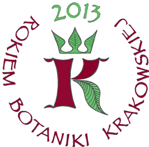
Ryc. 1. Logo Roku Botaniki Krakowskiej.

Część obchodów rocznicowych odbyła się poza Krakowem. Już w dniu 25 VI 2013 roku,