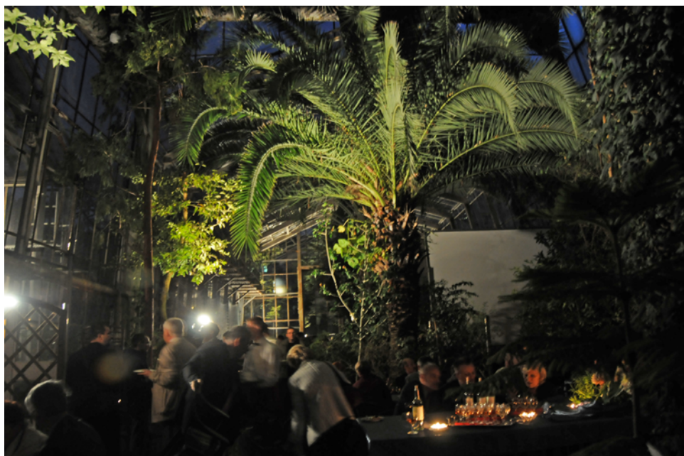
Ryc. 12. Spotkanie towarzyskie w szklarni Ogrodu Botanicznego.