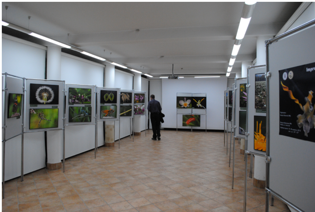
Ryc. 17. Wystawa fotografii Mariana i Michała Szewczyków „Impresje przyrodnicze w obiektywie” w Muzeum Przyrodniczym Instytutu Botaniki im. W. Szafera PAN.

Fig. 17. Photographic exhibition ‘Impressions of Nature in the objective lens’ by Marian and Michał Szewczyk at the Natural History Museum of the W. Szafer Institute of Botany, Polish Academy of Sciences.