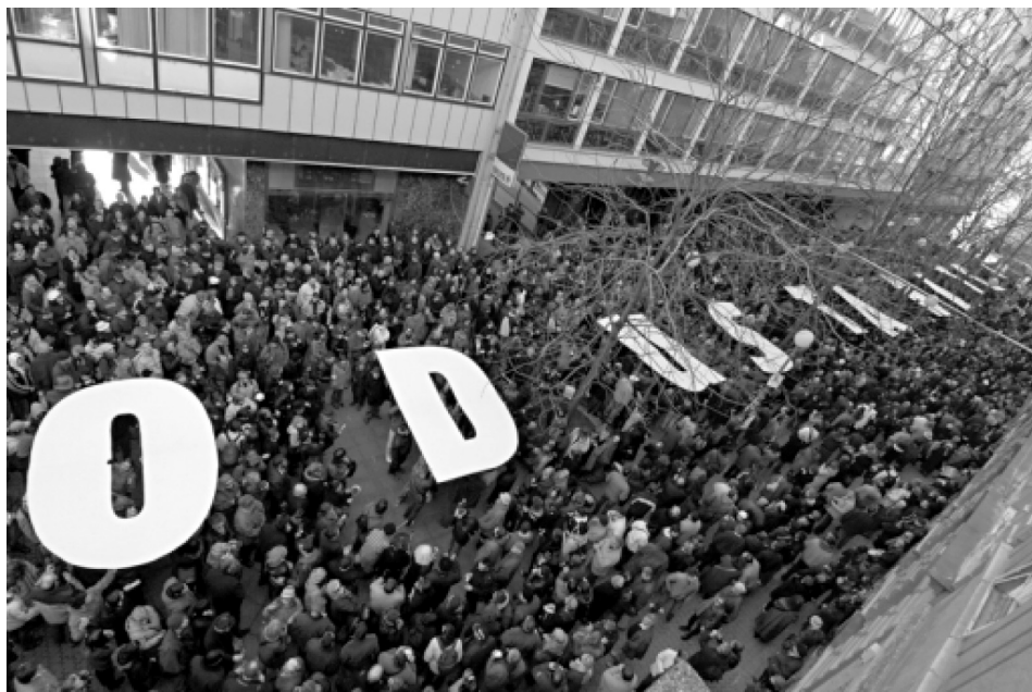
Slika 4. Prosvjed od 26. siječnja 2007.

http://www.pravonagrad.org/OdustaNite/pic3.jpg