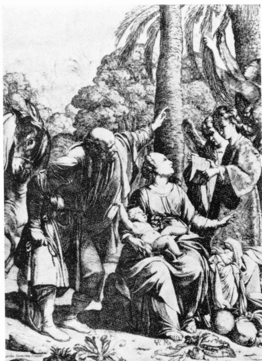
図 2) ジャン・ル・クレール「エジプトでの休息」 (サラチエニの作品にもとづく版画) Jean Le Clerc, Le repos en Egypte , gravure, d'après Saraceni