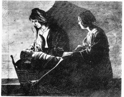
図 6) 作者不詳「夜明かしをする人々」(ラ・トゥールの作品にもとづく版画) Anonyme, Les veilleuses , gravure d'après La Tour