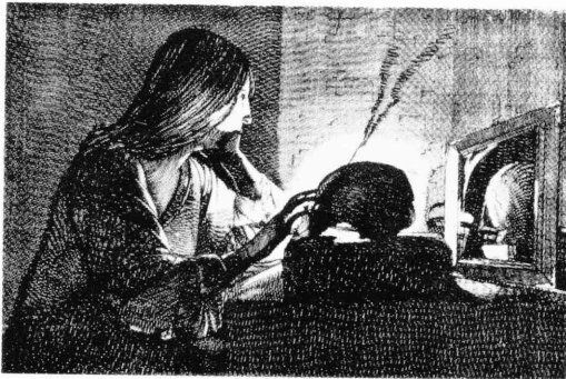
図 5) 作者不詳「鏡に向うマドレーヌ」(ラ・トゥールの作品にもとづく版画) Anonyme, La Madeleine au miroir , gravure d'après La Tour