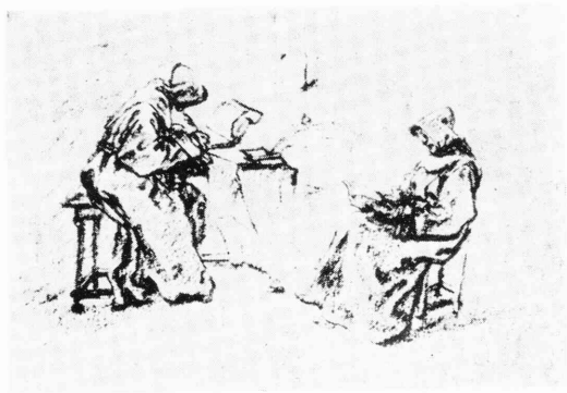
図 8) ジャック・カロー、「二人の僧侶」, レニングラード, エルミターージュ美術館 Jacques Callot, Deux moines , dessin, Leningrad Musée de l'Ermitage