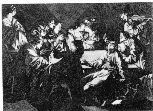
図 3) ジャン・ル・クレール? 「夜の演奏会」(ル・クレールの作品にもとづく版画) Jean Le Clerc?, Le concert nocturne , gravure d'après Le Clerc