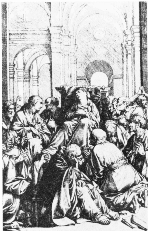
図 1) ジャン・ル・クレール「聖母の死」(サラチエニの作品にもとづく版画) Jean Le Clerc, La mort de la Vierge , gravure d'après Saraceni