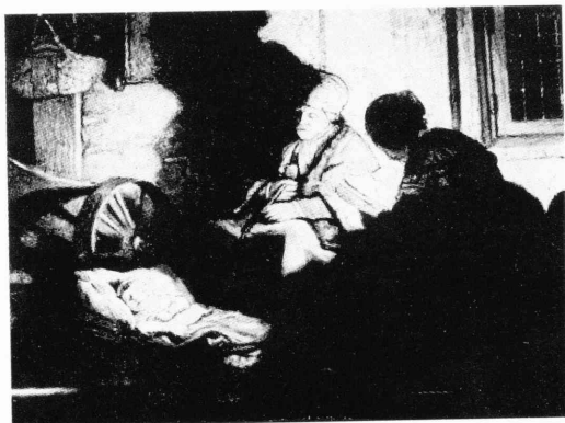
図 9) レンブラント、「聖家族」(部分図), アムステルダム, 国立美術館 Rembrandt, Sainte Famille , détail, Amsterdam, Rijksmuseum