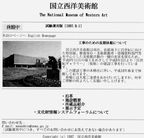
表1)国立西洋美術館 美術館情報システム 基本データ

基本構成: クライアント・サーバー型 サーバー=UNIX, クライアント=Windows 3.1, Mac 館内ネットワーク: 基幹=FDDI, 端末=10BASE-T 館外接続: SINET(学術情報ネットワークインターネット・バックボーン) 専用回線64Kbps(→東京大学大型計算機センター経由 国立4美術館間プライベートネットワーク (フレームリレー128Kbps[平成9年度より]) 接続機器: サーバー=7台(図書, 美術作品, メール, www等) pc=37台(Windows=34台, Mac=3台) プリンタ=ネットワーク接続:8台, ローカル:12台 入力済データ: 図書週及データ=5,986冊(洋書=5067, 和書=919) 美術作品データ=429点(絵画=336点, 彫刻=93点) 外部公開データ: (=web上, 文化財情報システム・美術情報システム共通索引用データ) 美術作品(絵画のみ)=32点