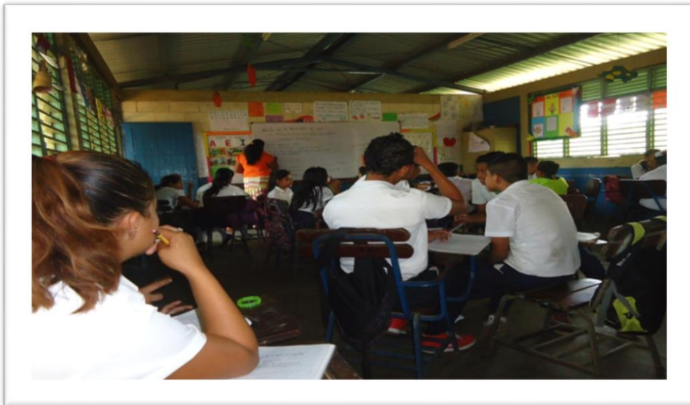
Mala organización del aula de clase.