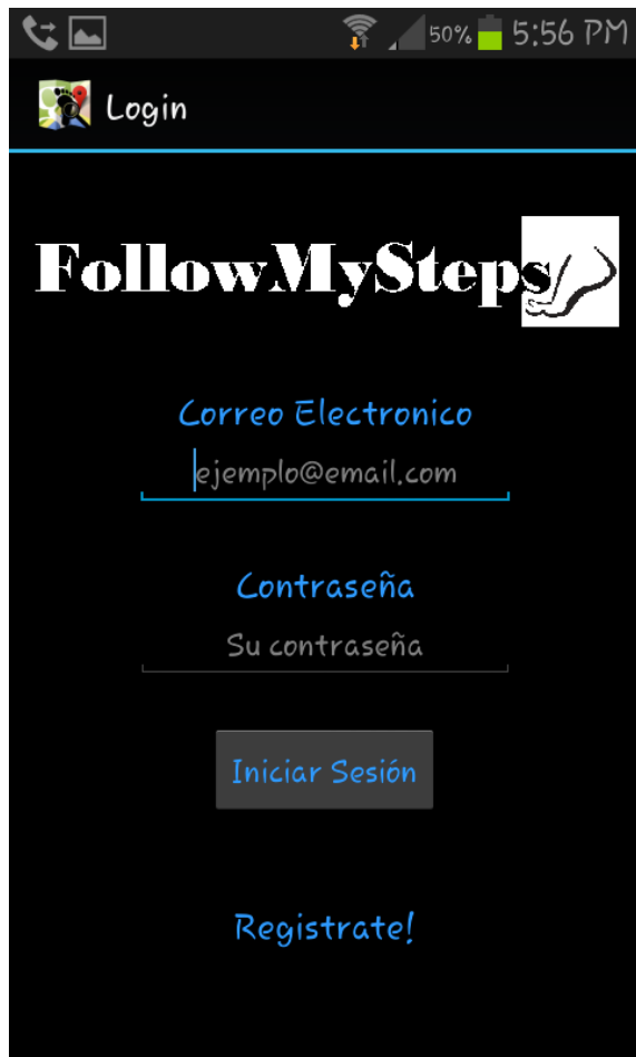
Fig 2. Ventana de Inicio de Sesión.