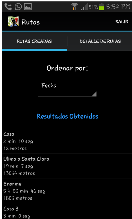
Fig 4. Ventana muestra de rutas.

Se implementará una vista de tabs, para mostrar las rutas creadas y el detalle de las rutas.