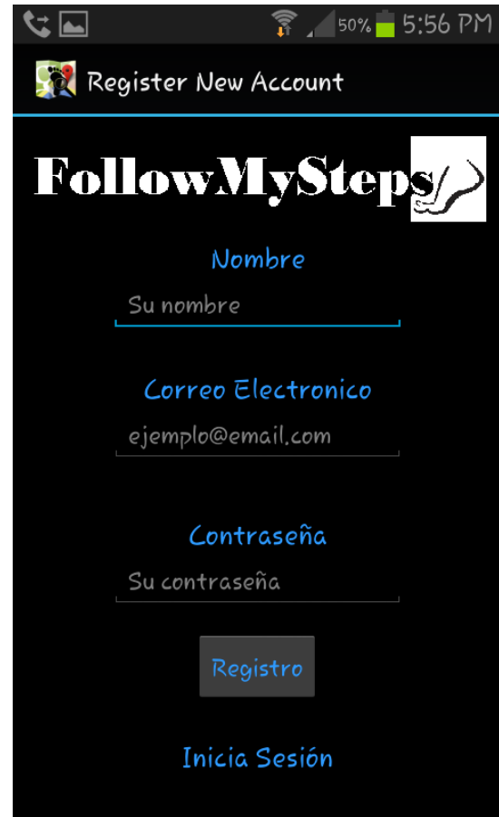
Fig 1. Ventana de registro de usuarios.

Para lograr iniciar sesión en la aplicación es requisito haber registrado un correo y una contraseña, es decir si no se posee una cuenta registrada, se debe proceder a la vista de registro y completar el formulario que se solicita, se debe suministrar un nombre, un correo electrónico y una contraseña, para poder ingresar a la aplicación.