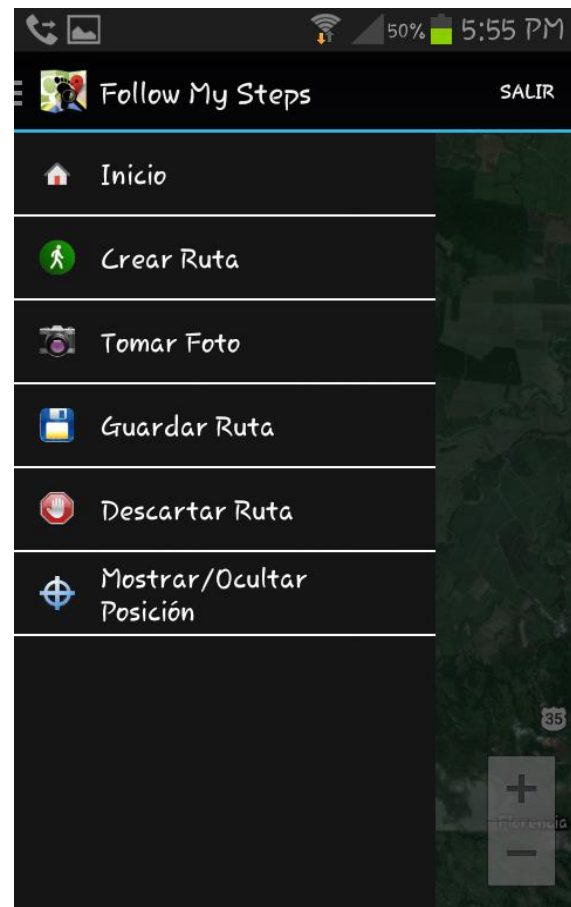
Fig 3. Menú con la se cuenta una vez iniciado sesión.

puede realizar entre ellas están; crear una ruta, guardar la ruta creada, descartar la ruta, mostrar u ocultar la posición actual, ir al inicio de la aplicación y tomar una foto.