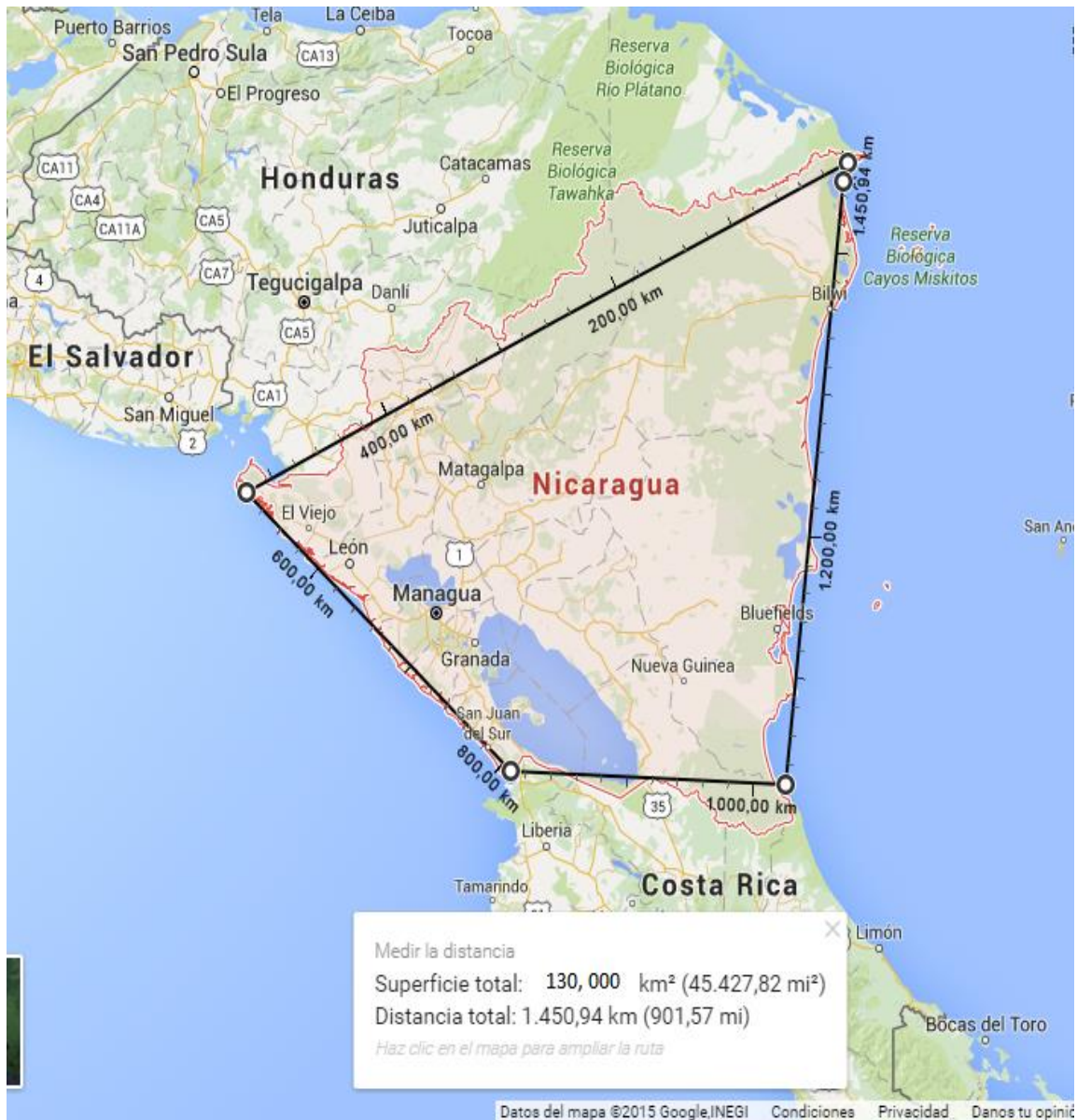
Ilustración 2: Medición de la extensión territorial de Nicaragua.

Hacemos Clic derecho sobre el mapa, luego damos la opción medir distancia y elegimos el lugar de dónde a dónde vamos a medir.