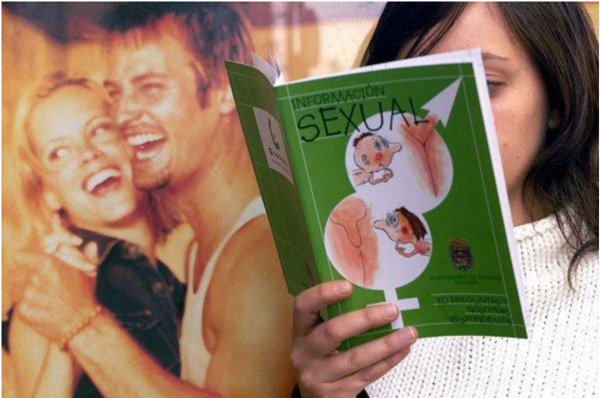
Una adolescente consulta un manual sobre sexualidad.

En torno a cuatro de cada diez adolescentes mencionan la curiosidad, el deseo de experimentar, la diversión y el disfrute entre los motivos para tener la primera relación sexual , aunque el 60 % asegura que estar enamorado también lo justifica, con diferencias por géneros.