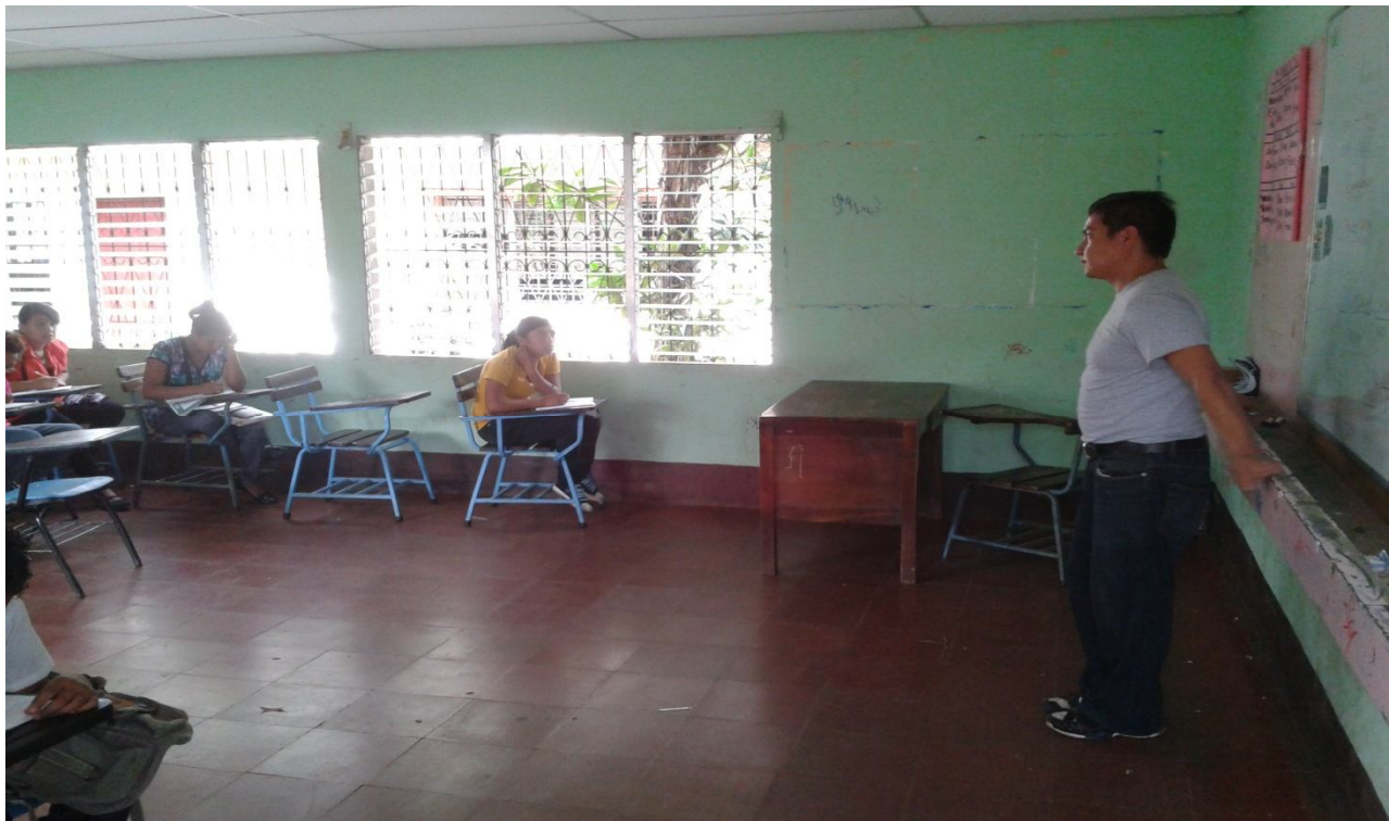
DOCENTE IMPARTIENDO CLASES DE REFORZAMIENTO