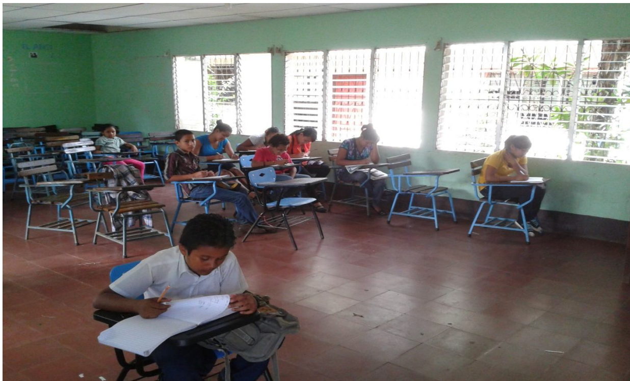
DISCENTES ATENDIENDO LAS ORIENTACIONES DEL DOCENTE.