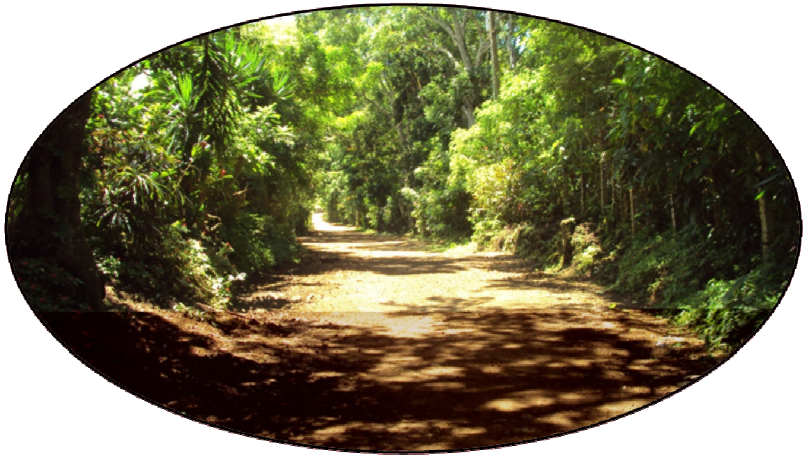
El Camino de la comunidad de Buena Vista