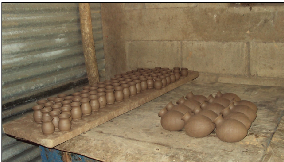
Artesanías elaboradas en barro por los pobladores de la comunidad.