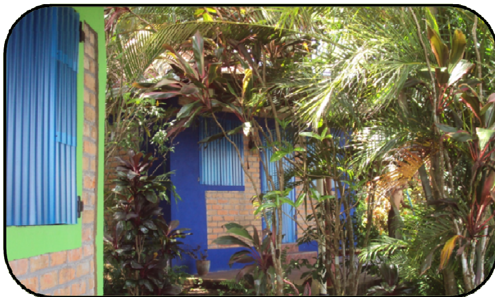
Estas son unas de las quintas de los residentes Norte Americano