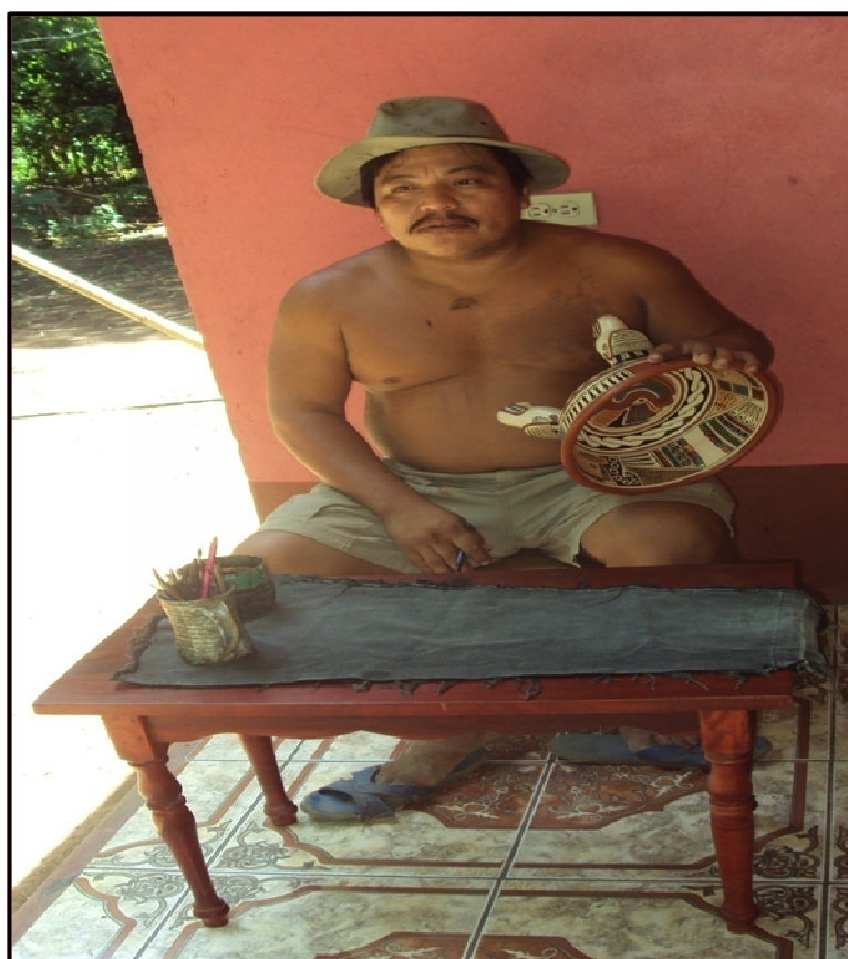
Artesano de la comunidad pintando unas de las piezas precolombina "El Tripo"