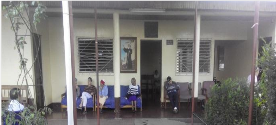
Hogar de Ancianos Club Santa Lucia

A través de las vivencias y experiencias de los/as adultos/as mayores podríamos desarrollar ideas, conocimientos sobre la cultura, que nos permitirían aprender sobre el buen vivir, aun entre tantas diferencias y percepciones ideológicas.