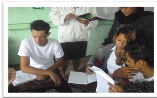
Realización de trabajos colaborativos