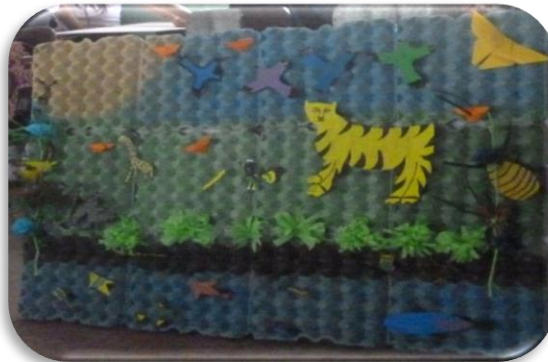
Elaboración y presentación de panel informativo