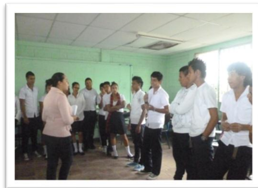
Dinámicas realizadas en el aula de clases.