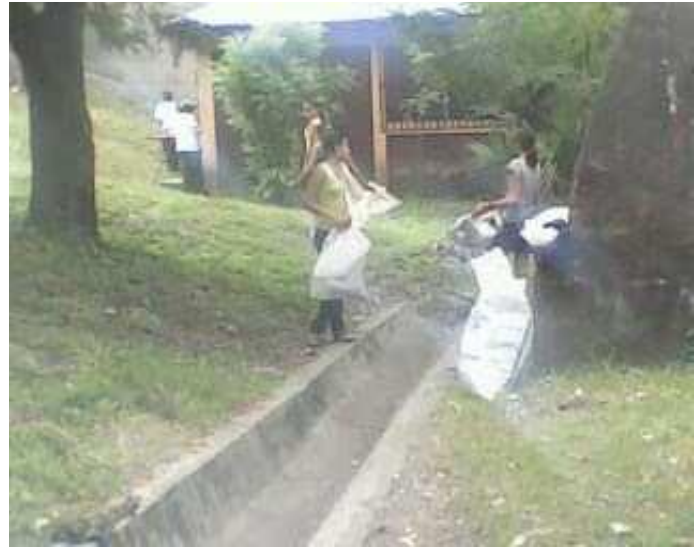
LIMPIEZA CONTIGUO A LA BIBLIOTECA Y DE CUNETAS