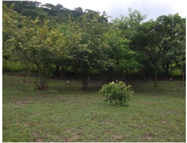
REFORESTACIÓN (ÁREA COLINDANTE DE LA LADERA DEL CERRO)