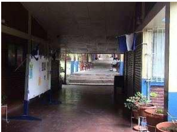
Entrada principal del centro