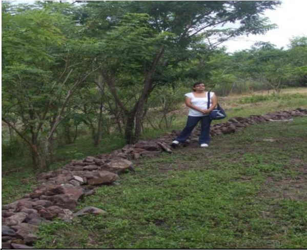
BARRERAS MUERTAS (CONTIGUO A LA ESC. URI MOLINA)