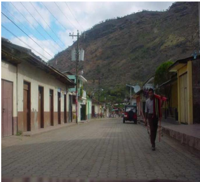
Vista de una calle en la ciudad de La Trinidad

La ciudad de la Trinidad está ubicada en los terrenos que correspondían a la hacienda ganadera de San José del Guasimal, nombre que se deriva por la cantidad de árboles de Guásimo existentes en el lugar, cuyas propietarias eran dos señoritas de apellido Garmendia originarias de Granada las que a consecuencia de la sequía regresaron a su ciudad natal, dejando sus bienes en herencia a una imagen de la virgen de la Merced.