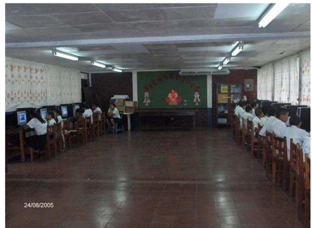
Área de Recursos Audiovisuales Tecnológicos (ARAT)