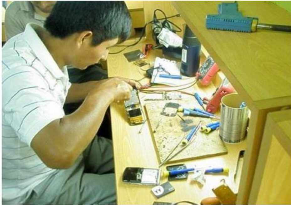
Foto 1. Trabajador reparando un celular.