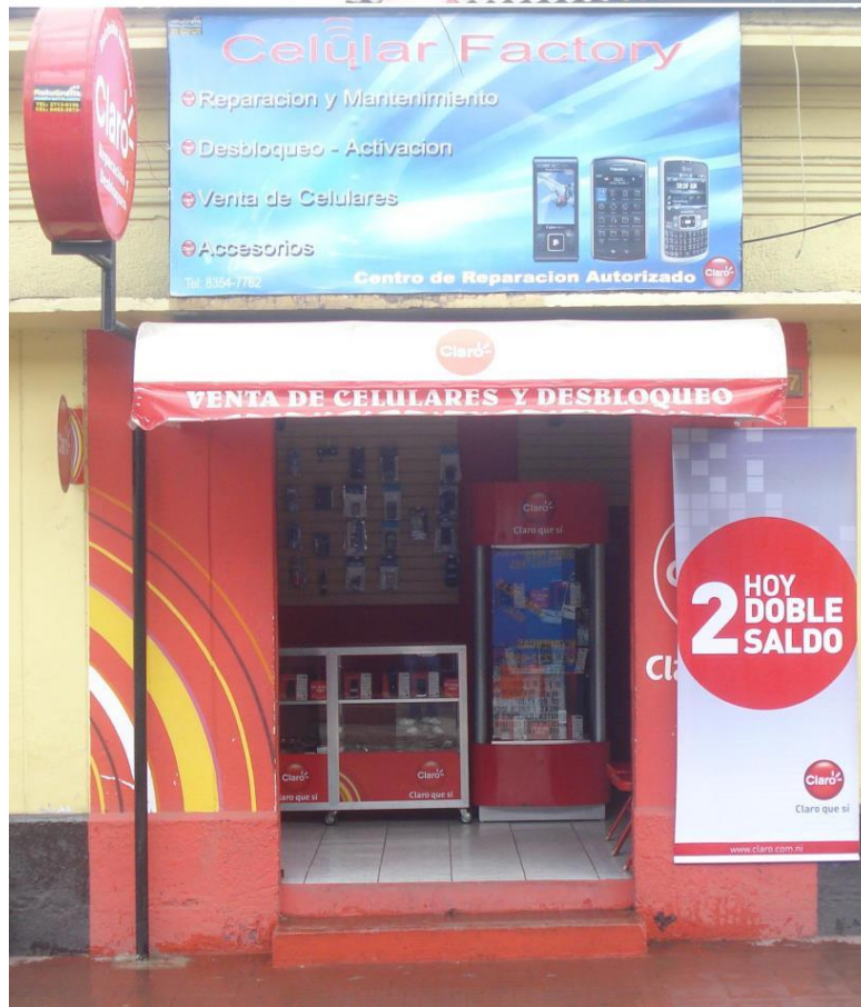
Foto 3: Factory Movil ubicado en el distrito I de la ciudad de Estelí.