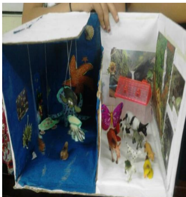
Estudiantes hacen uso de materiales del medio