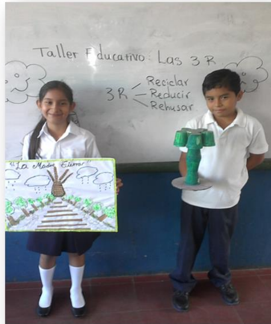
Manualidades de tercer grado