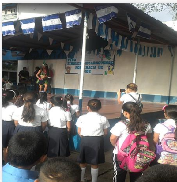
Estudiantes comparten con los demás niños del colegio conocimientos e importancia de no tirar la basura