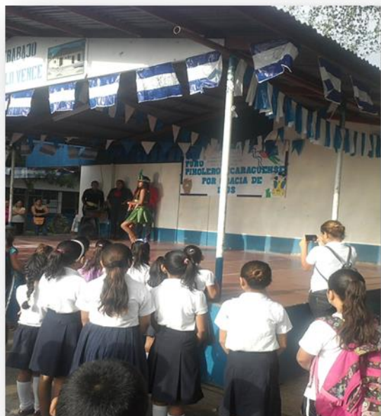
Festival realizado por estudiantes