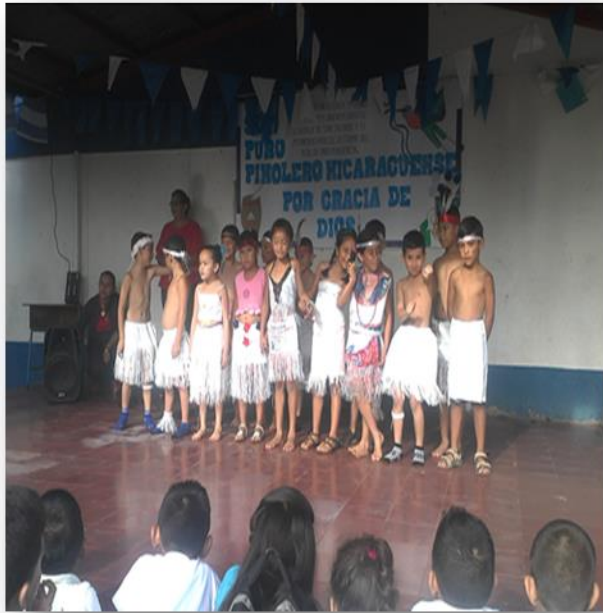
Los niños hacen uso de otros materiales que se pueden reciclar como sacos