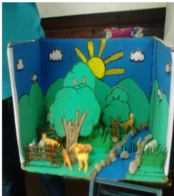
Estudiantes reciclan el cartón con manualidades