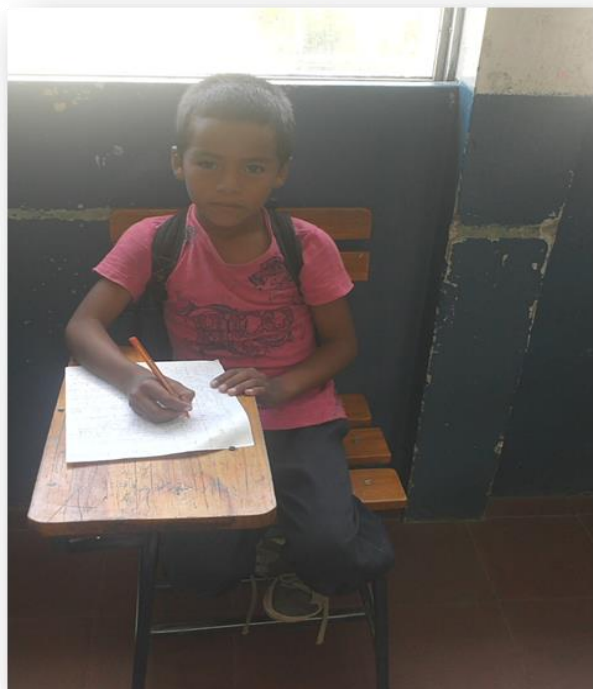
Estudiante de tercer grado responde a la entrevista