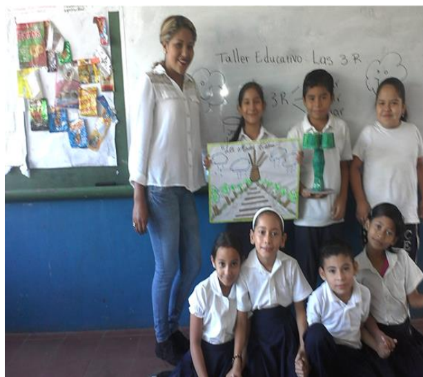
Niños dan la importancia de reciclar en las otras secciones