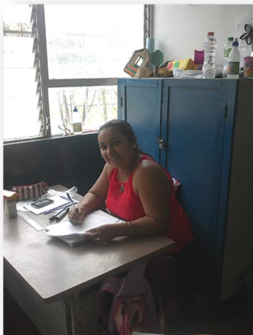
Foto docente respondiendo a la entrevista