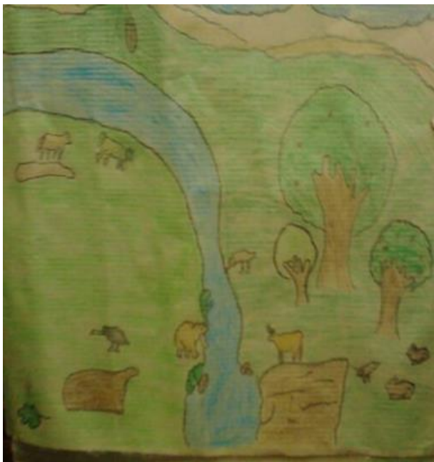
Manualidades elaboradas por estudiantes