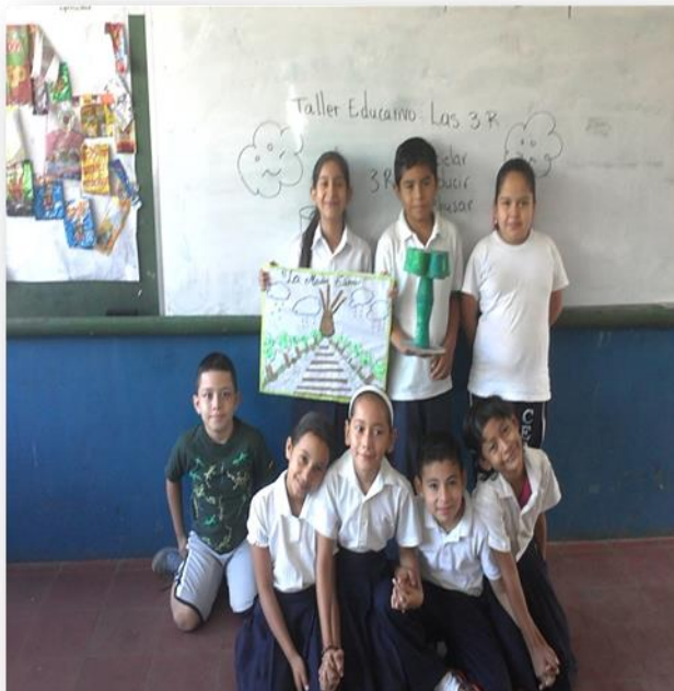
Niños compartiendo charlas en las demás secciones