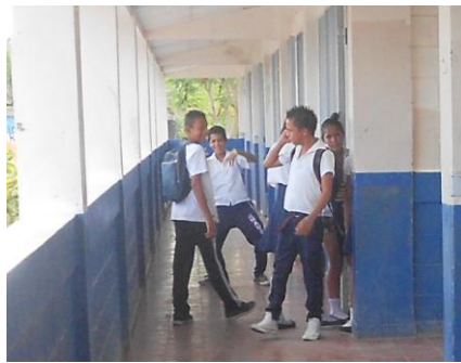
Foto N° 3 Agresiones en horas Clases Foto N° 4 Pierden el Interés y se salen de clases

Por otro lado, los estudiantes no muestran interés por las clases, debido a la poca motivación que reciben por el tipo de estrategias aplicadas, las cuales son muy tradicionalistas, dictan mucho, no toman en cuenta las particularidades de las y los estudiantes, lo que provoca que pierdan el interés, se salen de los salones, se agreden en horas de clases y no realizan trabajos asignados. La interacción social del estudiante con compañeros y maestros son importantes en el desarrollo cognitivo y social, todas aquellas expresiones, opiniones y conceptos que reciben de ellos condicionan positiva o negativamente su vida personal, repercutiendo en la motivación y el rendimiento académico, que pueda alcanzar la persona durante su proceso formativo.