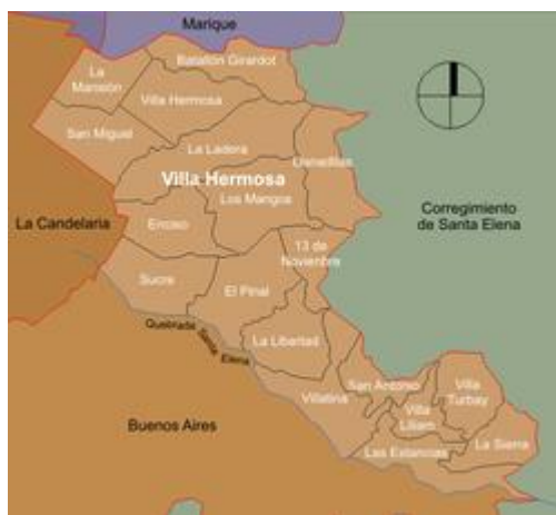
Ilustración 1 Mapa Comuna 8 "Villa Hermosa" - Medellín (Colombia)

Aires”. Cuenta con un área total de 577.74 hectáreas, las cuales se caracterizan por poseer grandes pendientes y por ende ser denominadas como zonas de alto riesgo dadas las malas prácticas constructivas y asentamientos humanos en zonas declaradas no aptas, además, cuenta con una Junta Administradora Local (JAL) que cumple funciones concernientes con los planes y programas municipales de desarrollo económico y social de obras públicas, vigilancia, control a la prestación de los servicios municipales y en general vela por el cumplimiento de sus decisiones y promueve la participación ciudadana.