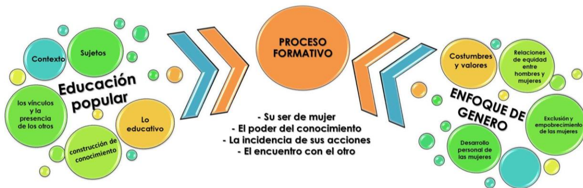
Ilustración 4 Esquema General del proceso de Formación

Por consiguiente, se propone desarrollar un proceso formativo que en primer lugar, parta del reconocimiento de las condiciones de exclusión y empobrecimiento de las mujeres; en segundo lugar, que asuma la educación popular como referente para la fundamentación del proceso y de las acciones pedagógicas; en tercer lugar, que incorpore el enfoque de género en los contenidos y en la metodología, toda vez que se reconoce que las mujeres se encuentran en condiciones de desigualdad y, por último, un proceso que apropie desde una perspectiva metodológica, los cuatro componentes identificados en las prácticas educativas desarrolladas por las líderes de la comuna 8 (El descubrimiento de su ser de mujer, el descubrimiento del conocimiento, el descubrimiento de la incidencia de sus acciones y el descubrimiento del encuentro con el otro).