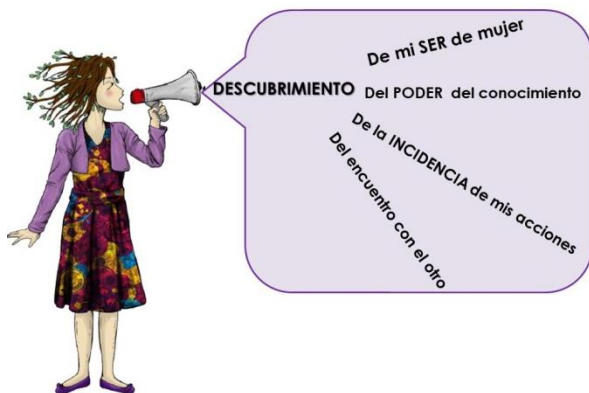
Ilustración 3 Componentes del descubrimiento como Sujetos Sociales

En este sentido, se esbozan unos componentes que ofrecen unas pistas para comprender los elementos que confluieron en el proceso que facilitaron que las líderes fueran descubriéndose como sujetos sociales, así: