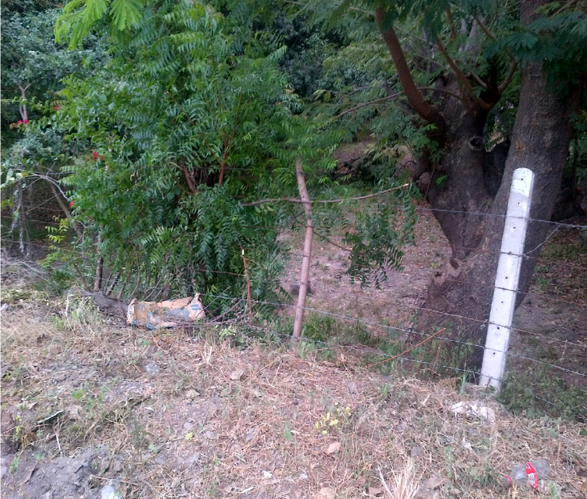
Quebrada que corre paralelo a la entrada principal del Barrio Julián Roque Cuadra.