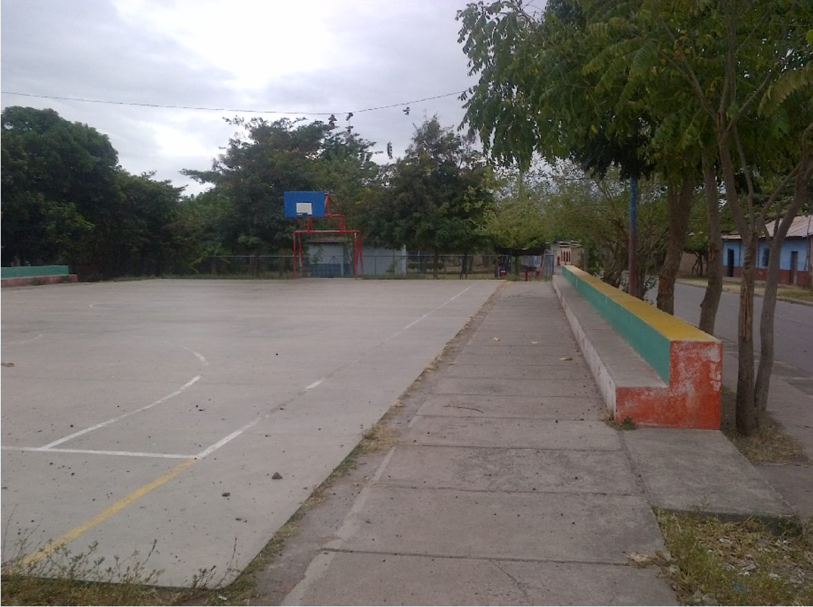
Cancha de basquetbol del Barrio Julián Roque Cuadra.