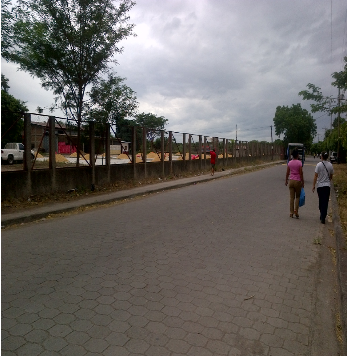
Entrada principal al Barrio Julián Roque Cuadra.