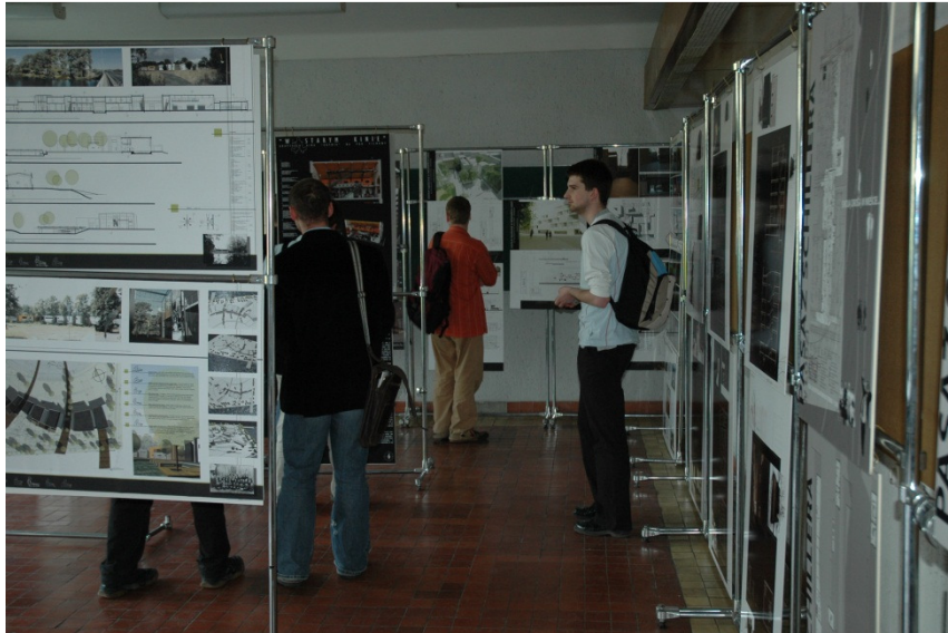
Wystawa prac dyplomowych w ramach Festiwalu Nauki i Techniki