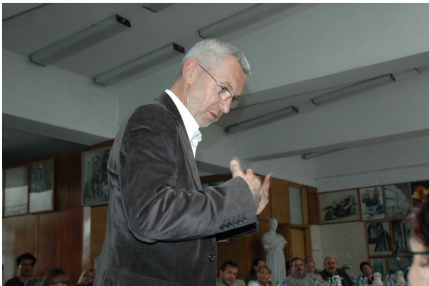
Kolegium Konsultacyjne, czerwiec 2007 r.; przemawia architekt prof. Stefan Kuryłowicz