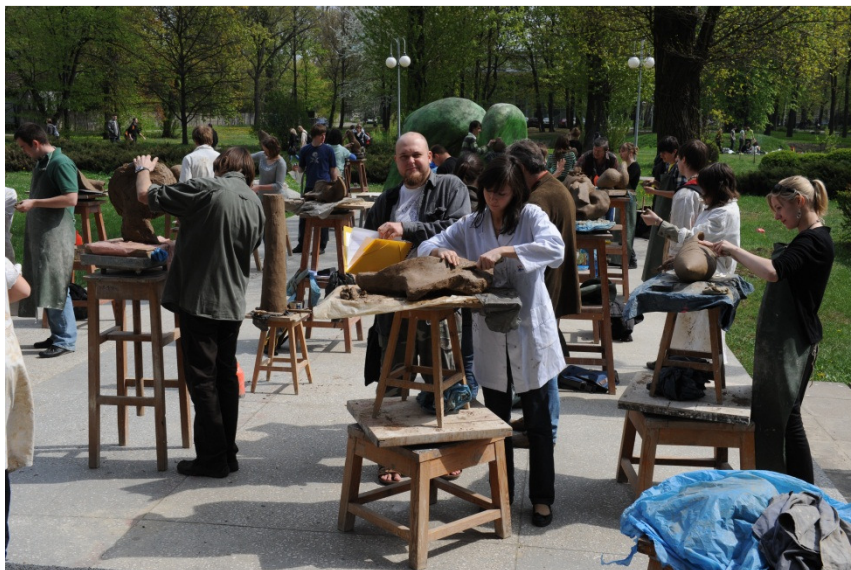
Rzeźba w plenerze w ramach Festiwalu Nauki i Techniki