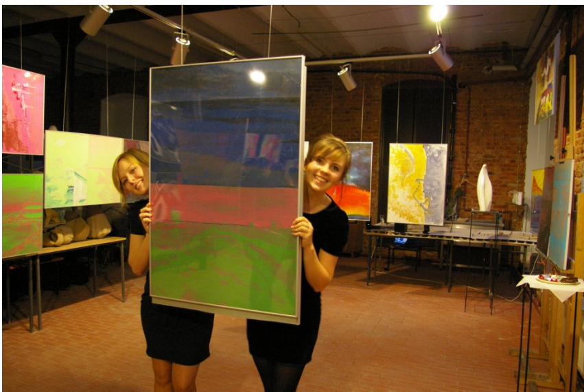
Wystawa poplenerowa malarska