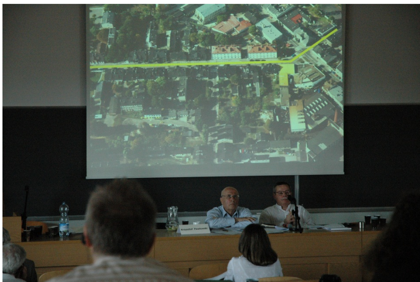
Konferencja Pro-Revita 2008 r. Modele rewitalizacji i ich zastosowanie w miastach dziedzictwa europejskiego