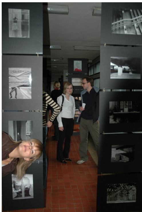
Wystawa prac studenckich z przedmiotu fotografia