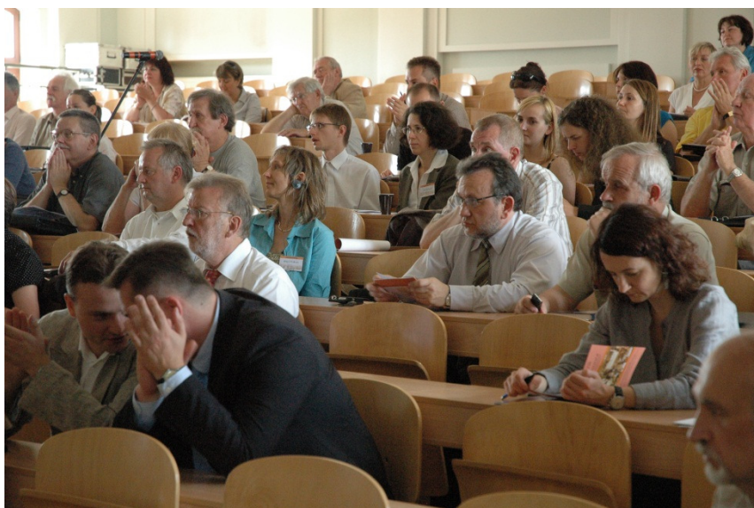
Konferencja Pro-Revita 2008 r. Modele rewitalizacji i ich zastosowanie w miastach dziedzictwa europejskiego