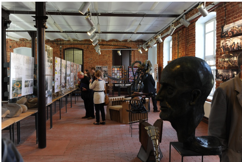
„Wystawa Pedagogów”, czerwiec 2010 r.