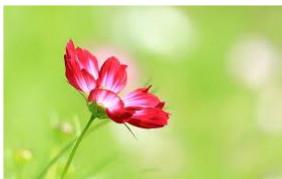
Рис. 1. Исследуемое изображение

вого изображения с различной яркостью, в котором по горизонтальной оси представлена яркость, а по вертикали – относительное число пикселей с конкретным значением яркости. Алгоритм построения RGB гистограммы следующий: из каждого пикселя изображения (рис. 1) считывается значения яркости его R, G и B составляющих и добавляются в ячейку соответствующего массива, содержащую такое же значение яркости. Затем, когда все пиксели будут обработаны, строится RGB гистограмма, в которой содержатся значения всех трех цветовых составляющих (рис. 2). Например, на гистограмме видно, что яркость зеленой составляющей у данного изображения гораздо больше, чем синей. Чтобы проверить правильность построенной диаграммы, сравним полученный результат с гистограммами, созданными для данного изображения в растровом графическом редакторе GIMP (рис. 3).