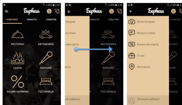
Рис. 2. Элемент Navigation Drawer

Также в приложении был использован ещё один удобный элемент Navigation Drawer, который представляет собой панель, появляющуюся с левого края экрана телефона при пролистывании от края вправо. Данный элемент используется для быстрого перехода на различные экраны приложения без необходимости возвращения на главное меню. Элемент показан на рис. 2.