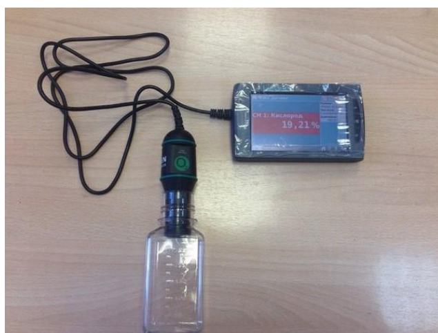
Рис. 1. Фото прибора LabQuest 2

Устройство измерения и обработки данных (УИОД) LabQuest 2 (рис. 1) – это специализированное портативное электронно-вычислительное устройство, обладающее широкими функциональными возможностями. УИОД LabQuest 2 предназначено для непосредственной автоматической цифровой обработки сигналов в режиме реального времени. Устройство включает себя программное обеспечение для измерения, регистрации, визуализации, обработки и хранения экспериментальных данных.