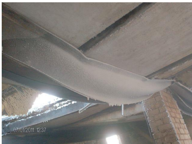
Рисунок 3 – Деформированная несущая двутавровая балка

Данные полученные по второму сценарию Q_B=7,1 \cdot 10^{-7} \text{ год}^{-1} . Третий сценарий показал, что величина Q_B=7,1 \cdot 10^{-7} \text{ год}^{-1} . В целом пожарный риск составил величину Q_B=1,44 \cdot 10^{-6} \text{ год}^{-1} .