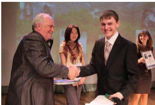
Рис. 43. Награждение лауреатов XVI Международного научного симпозиума им. академика М.А. Усова (2012 г.)

2–7 апреля 2012 года состоялся юбилейный XVI Международный научный симпозиум им. академика М.А. Усова "Проблемы геологии и освоения недр", посвященный 110-летию со дня рождения профессора, Заслуженного деятеля науки и техники России Л.Л. Халфина и 40-летию научных молодежных симпозиумов академика им. М.А. Усова «Проблемы геологии и освоения недр». Заявлено 989 докладов 1020 авторов из 52 ВУЗов и НИИ и представителей РАН из городов России и стран СНГ, а также из Англии, Индии, Германии, Венгрии, Чехии, США, Франции. Работала 21 секция и круглый стол.