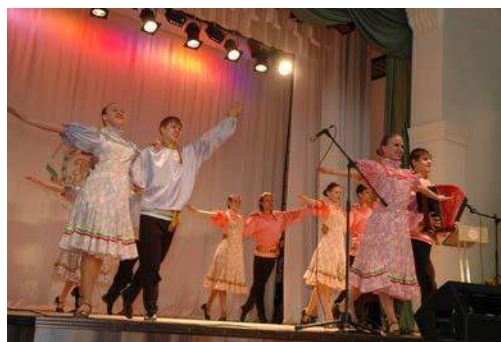
Рис. 42. 2011 год. Праздничный концерт на закрытии XV Международного симпозиума им. академика М.А. Усова

2–7 апреля 2012 года состоялся юбилейный XVI Международный научный симпозиум им. академика М.А. Усова "Проблемы геологии и освоения недр", посвященный 110-летию со дня рождения профессора, Заслуженного деятеля науки и техники России Л.Л. Халфина и 40-летию научных молодежных симпозиумов академика им. М.А. Усова «Проблемы геологии и освоения недр». Заявлено 989 докладов 1020 авторов из 52 ВУЗов и НИИ и представителей РАН из городов России и стран СНГ, а также из Англии, Индии, Германии, Венгрии, Чехии, США, Франции. Работала 21 секция и круглый стол.