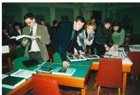
Рис. 18. 2002 год. Участники VI Международного симпозиума им. академика М.А. Усова знакомятся с выставкой научных достижений молодежи ИГНД