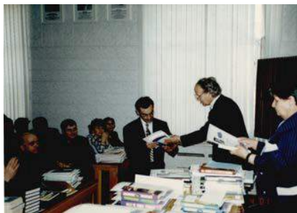
Рис. 12. 1997 год. Награждение лауреатов на закрытии II Международного симпозиума им. М.А Усова