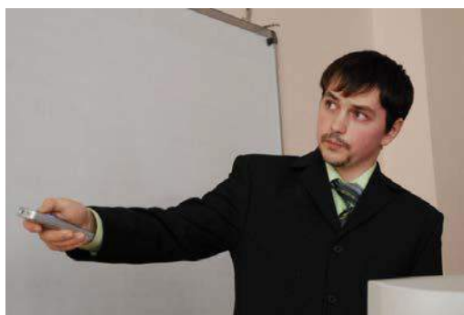
Рис. 32. 2008 год. Выступление с докладом на секции «Геология нефти и газа» на XII Международном научном симпозиуме им. академика М.А. Усова