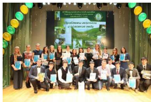
Рис. 51. 2015 г. Лауреаты секции «Геология нефти и газа» XIX Международного симпозиума им. М.А. Усова

В период работы симпозиума на каждой секции работают конкурсные комиссии, которые определяют лауреатов лучших научных работ по каждому из своих направлений. Все победители награждаются дипломами и ценными призами, всем участникам вручаются сертификаты и сувениры.