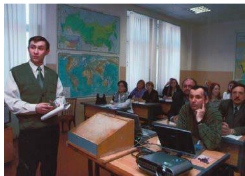
Рис. 23. 2005 год. Работа секции «Геоэкология» на IX Международном симпозиуме им. академика М.А. Усова

11 – 15 апреля 2005 года проходит IX Международный научный симпозиум им. академика М.А. Усова "Проблемы геологии и освоения недр", посвященный 60-летию победы Советского народа над фашизмом в Великой Отечественной войне 1941-1945 гг. Заслушаны 586 доклад 598 авторов. Приняли участие 48 ВУЗов и НИИ, а также представители из Вьетнама и Кипра.