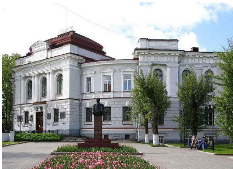
Рис. 2. Первый корпус ТПУ (горно-геологический) с памятником М.А. Усову

Первая научная студенческая геологическая конференция была организована и проведена в 1946 г.