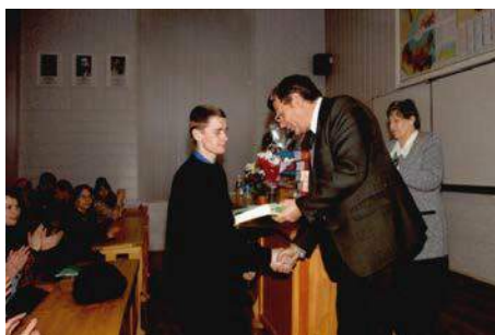
Рис. 16. 2001 год. Закрытие V Международного научного симпозиума им. академика М.А. Усова. Награждение лауреатов симпозиума.