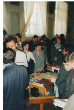
Рис. 11. 1996 год. Участники I Международного симпозиума им. М.А. Усова знакомятся с выставкой научных достижений студентов

13–25 апреля 1999 года проводится III Международный научный симпозиум им академика А. М. Усова "Проблемы геологии и освоения недр", который проходил в рамках российской научно-социальной программы для молодежи и школьников «Шаг в будущее». Посвящен он был 100-летию со дня рождения академика К. И. Сатпаева, бывшего студента, выпускника ГРФ, академика и создателя Казахской академии наук. 1999 год – по решению ЮНЕСКО при организации ООН данный год был объявлен годом академика К. И. Сатпаева. На симпозиуме было заслушано 428 докладов из 34 городов России и стран СНГ. Работало