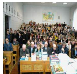
Рис. 21. 2003 год. Работа VII Международного научного симпозиума им. академика М.А. Усова