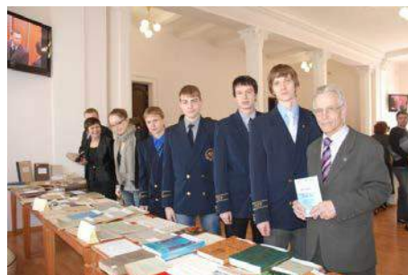
Рис. 37. 2010 год. Студенты на выставке научных достижений молодежи ИПР. XIV Международный научный симпозиум им. академика М.А. Усова