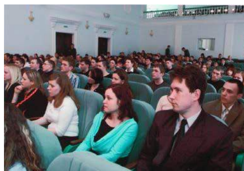
Рис. 28. 2006 год. Закрытие X Международного симпозиума им. академика М.А. Усова в Международном культурном центре ТПУ