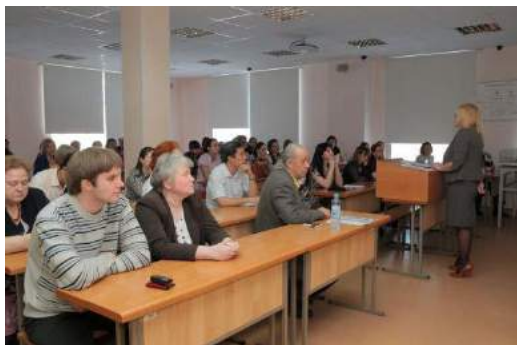
Рис. 48. 2014 г. XVIII Международный симпозиум и.м. М.А. Усова. Работает секция «Гидрогеология и инженерная геология»

направление «Космогеологию». Кроме того, планируется проведение некоторых секций с использованием залов 3-D визуализации с зарубежными участниками.