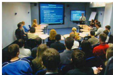
Рис. 19. 2002 год. Работа секции «Современная нефтегазопромысловая техника и её совершенствование» на VI Международном научном симпозиуме им. академика М.А. Усова