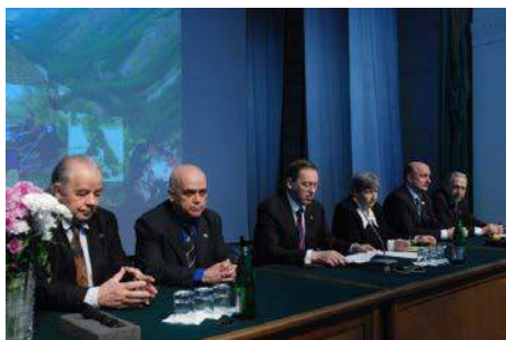
Рис. 36. 2010 год. Открытие XIV Международного научного симпозиума им. академика М.А. Усова. В президиуме – Заслуженные профессора ТПУ

5 – 9 апреля 2010 года был проведен XIV Международный научный симпозиум им. академика М.А. Усова "Проблемы геологии и освоения недр", посвященный 65-летию Победы Советского народа над фашистской Германией в Великой Отечественной войне 1941-1945 гг. Заслушаны 886 докладов 983 авторов. Участвовали представители 50 ВУЗов и НИИ, а также РАН и ее филиалов. Представители дальнего зарубежья – Вьетнама, Чехии, Венгрии, Германии, США, Франции.