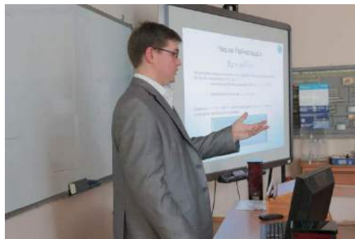
Рис. 49. 2014 г. XVIII Международный научный симпозиум и.м. академика М.А. Усова. Выступает студент на секции «Современные технологии разработки нефтяных и газовых месторождений»

Симпозиум проходит по всем фундаментальным и прикладным направлениям геологического профиля. На каждой из научных направлений симпозиума выступают ведущие специалисты и ученые по проблемным вопросам геологии и недр Земли в XXI веке.