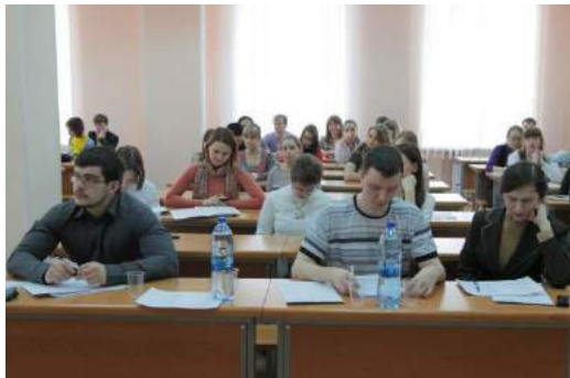
Рис. 47. 2013 г. Работает секция «Геология, горное и нефтегазовое дело на английском языке».

Ближнее зарубежье (страны СНГ) представили 58 докладов из 9 стран: из Национальных Академий наук и вузов Украины, Белоруссии, Казахстана, Латвии, Азербайджана, Армении, Узбекистана, Киргизии, Таджикистана.