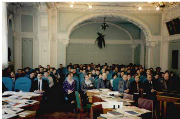
Рис. 10. 1996 год – На открытии I Международного симпозиума им. М.А. Усова, который сопровождался выставкой научных достижений молодежи

основания ТПУ (ТПИ). В нем приняли участие 27 ВУЗов, научных и производственных организаций России и стран СНГ, представители Китая и США. Был проведен круглый стол по теме: «Молодежь. Наука. Проблемы».