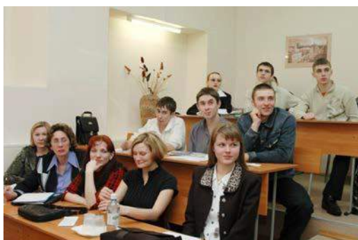
Рис. 27. 2006 год. Работа секции «Геология и нефтегазовое дело» на английском языке на X Международном симпозиуме им. академика М.А. Усова