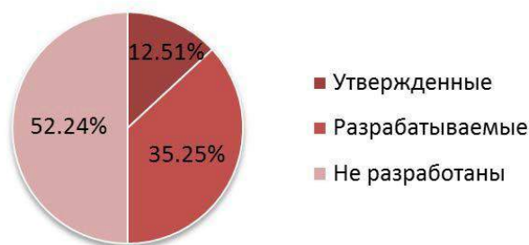
Рис. 2. Соотношение существующих и разрабатываемых проектов планировки и проектов межевания территории г. Томска

Во-вторых, одной из основных причин отказа в предварительном согласовании предоставления земельных участков для строительства инженерных коммуникаций является наличие на запрашиваемом земельном участке сооружений - автомобильных дорог общего пользования местного значения муниципального образования. В соответствии с пп.2 п.8 ст.39.15 и п.5 ст.39.16 Земельного кодекса Российской Федерации в случае, если на земельном участке, указанном в заявлении о предварительном согласовании предоставления земельного участка, расположено сооружение, находящееся в муниципальной собственности, уполномоченный орган принимает решение об отказе в предварительном согласовании предоставления земельного участка. Согласно п.10 ст.23 Земельного кодекса Российской Федерации и Федеральным законом от 08.11.2007 №257-ФЗ «Об автомобильных дорогах и о дорожной деятельности в Российской Федерации и о внесении изменений в отдельные законодательные акты Российской Федерации» размещение инженерных коммуникаций в границах полос отвода автомобильных дорог осуществляется в порядке и на условиях установления публичного сервитута [5].