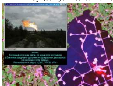
Рис. 1. Снимок Landsat 7, 23 мая 2000 г. Инфракрасная камера с разрешением 30 метров [5]

Существует несколько методик детектирования воздействий нефтегазовой индустрии на окружающую среду на базе данных дистанционного зондирования Земли. Такие методики позволяют решить целый комплекс задач: выработка методических рекомендаций по организации мониторинга состояния природной среды в местах добычи нефти и газа; создание инструмента комплексной оценки экологических последствий добычи нефти и газа; оценка накопленного воздействия нефте- и газодобычи на природную среду.