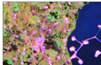
Рис. 2. Самолгорское месторождение. Снимок Terra/Aster. Пространственное разрешение 15 м. 2 июля 2002 г. Участок, загрязненный нефтепродуктами. Цифрой 1 обозначено загрязнение, скрытой вторичной растительностью [1]