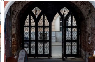
Рис. 1 Ограда Михайловского сада в Петербурге