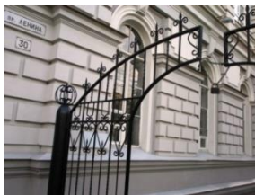
Рис. 5 Ворота корпуса НИ ТПУ

ле (смешение стилей). Это элементы классицизма и ренессанса. Подобная архитектура отличается монументальностью фасадов, простотой, отсутствием вычурности декора. Следовательно, и изделия художественнойковки имеют аналогичный характер и стиль.