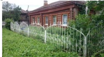
Рис. 3 Козырёк, ул. Ленина, г. Суздаль