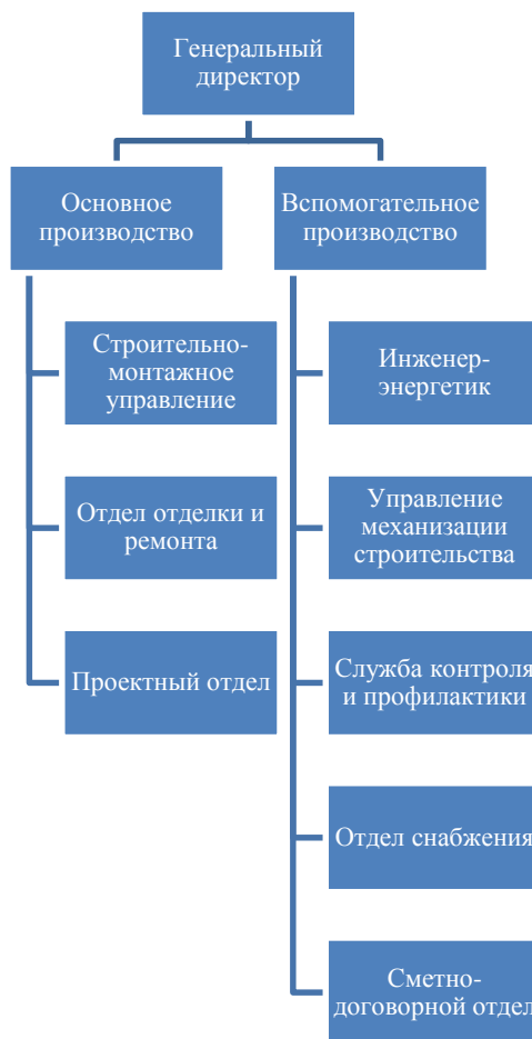
Рисунок 1 - Производственная структура ООО "Домстрой"

контроля и профилактики, отделом снабжения и сметно-договорным отделом, помогают основному производству осуществлять производственный (строительный) процесс.