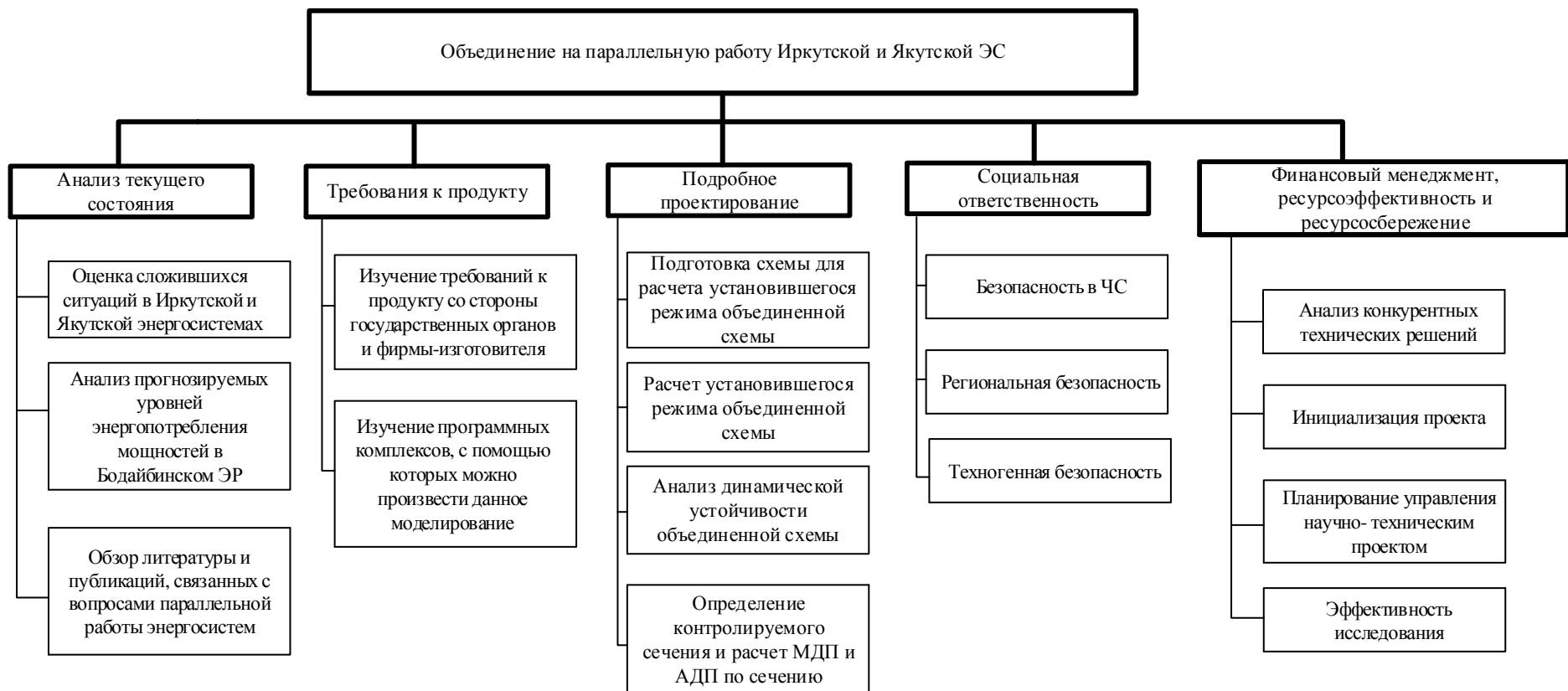
Рисунок 3.2 – Иерархическая структура проекта